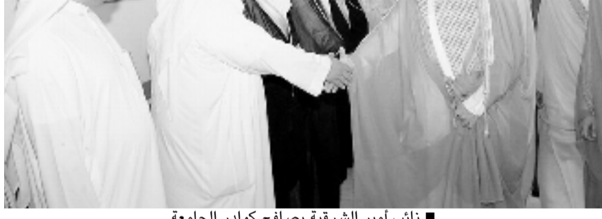
■ نائب أمير الشرقية يصافح كوادر الجامعة

المرحلة الحالية التي تستخدم فيها أحدث تقنيات الري الزراعي. وقدم الدهيش عرضاً متكاملاً حول الدراسات التي ابرمتها الهيئة منذ تاسيسها مع العديد من الجهات المعنية والتي أسفرت عن تدشين العديد من المشاريع الملحقه بالهيئة مشيراً الى مشروع التحسين الزراعي بالتكثيف، ومشروع الخرج الزراعي، ومشروع تنمية الزراعة بالافلاج، ومركز التدريب البيطري والانتاج الحيواني بالأحساء، اضافة لمشروع مصنع تعبئة الثور