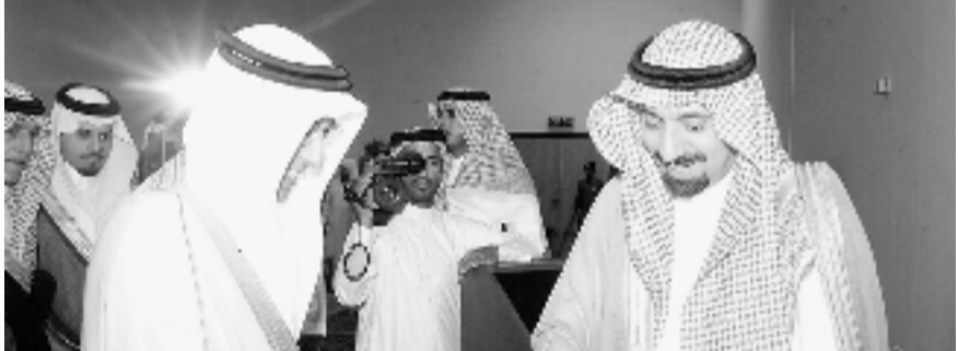
■ الأمير جلوي يستعرض مع د. الجندان منجزات الجامعة

الجديدة، وأهم الإنجازات العمرانية الجارية الانشاء والمشروعات تحت الترسية في الاحساء والدمام. كما ألقى وكيل الجامعة للدراسات العليا والبحث العلمي د. عبدالله السعادات كلمة أوضح فيها أن مجموع المكتبات التي تضمها الجامعة تبلغ ١٣ جامعة منها (اثنان مركزيات) في الاحساء والدمام، والباقي موزعة على الكليات. وفي نهاية اللقاء تسلم سمو الأمير مجموعة من اصدرات الجامعة، ثم قام سموه بجولة