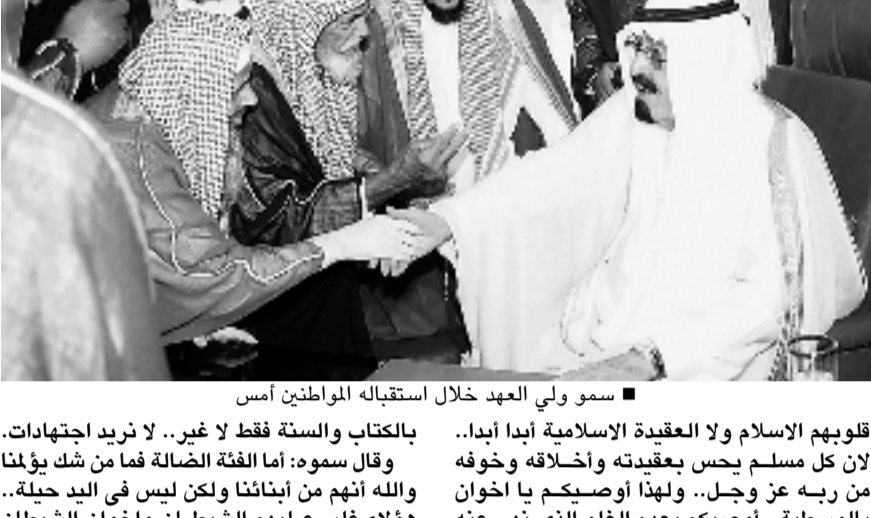
■ سمو ولي العهد خلال استقباله المواطنين أمس

شاهدتم من أبنائنا وأبنائكم من علوا التفجيرات وغيرها وعلوا أكبر من ذلك وهو تشويه العقيدة الإسلامية في العالم.. وهذه اعقاب عليها أي مخلوق.. ولكن ان شاء الله انهم مدحورون هم والذين وراءهم.. وأعتقد أن هوءاء ما دخل في