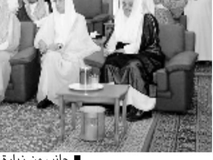
■ جانب من زيارة الأمير جلوي للجامعة

وأضاف سموه: انطلاقاً من ذلك انبرت فكرة جائزة الأمير محمد بن فهد للاداء الحكومي المتميز لتكون تحفيزاً صادقاً عن توجيهات الدولة في خدمة المواطن والمقيم على حد سواء