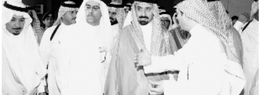
■ ويزور هيئة الري والصرف

بالأحساء. ومن ثم زار سموه مصنع تعبئة التصور بالاحساء، واطلع على مراحل اعداد وتصنيع وتكثيف الثور.