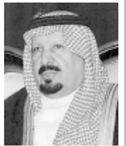
الأمير عبد الرحمن بن عبدالعزيز

يرعى صاحب السمو الملكي الأمير عبد الرحمن بن عبد العزيز نائب وزير الدفاع والطيران والمفتش العام اليوم حفل تخريج معهد قوات الدفاع الجوي بجدة. وأوضح قائد كلية الدفاع الجوي وقائد معهد الدفاع الجوي بالنيابة اللواء الركن سعد محمد العتيبي أن معهد قوات الدفاع الجوي يخرج كل عام العديد من أبناء هذا الوطن الغالي في مختلف دورات وتخصصات الدفاع الجوي لينضموا إلى اخوانهم الضباط وضباط الصف وجنود قوات الدفاع الجوي للاسهام في الدفاع عن وطننا ومقدساتنا جنباً إلى جنب قطاعات القوات المسلحة. وقال اللواء الركن العتيبي في تصريح وكالة الأنباء السعودية بهذه المناسبة أن معهد قوات الدفاع الجوي يحظى منذ إنشائه بمؤسسات التعليم والتدريب في وقتنا المسلة بالعناية والدعم من خادم الحرمين الشريفين القائد الأعلى لجميع القوات العسكرية وسمو ولي عهد الأمين وسمو النائب الثاني لرئيس مجلس الوزراء وزير الدفاع والطيران والمفتش العام حفظهم الله.