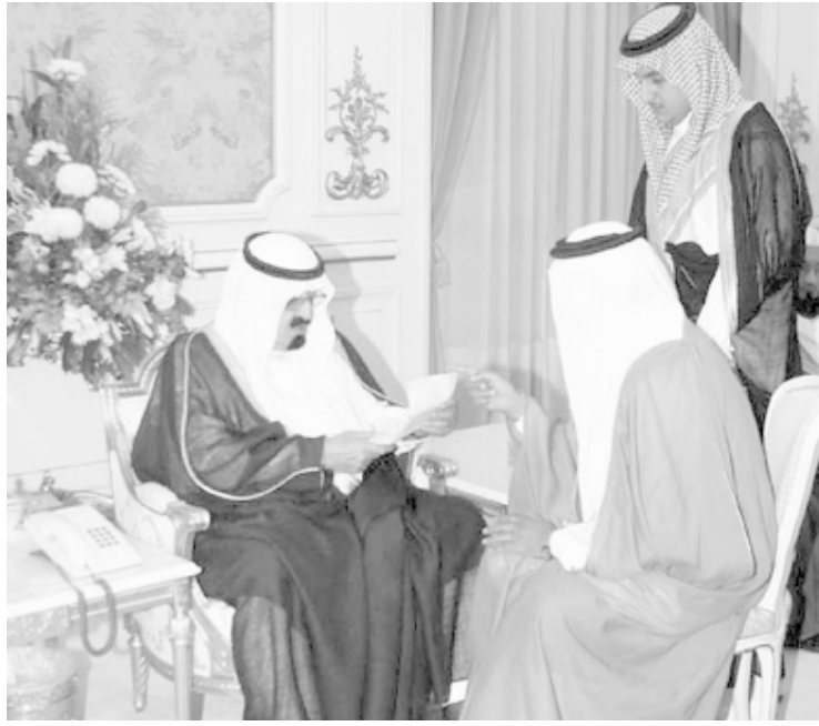
سمو ولي العهد يستقبل المواطنين