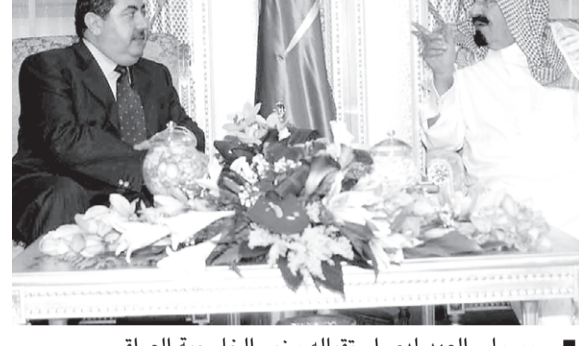
سمو ولي العهد لدى استقباله وزير الخارجية العراقي

مكة المكرمة - واس تسلم صاحب السمو الملكي الامير عبدالله بن عبدالعزيز ولي العهد نائب رئيس مجلس الوزراء رئيس الحرس الوطني رسالة من دولة رئيس الوزراء العراقي الدكتور اياد علاوي. وقام بتسليم الرسالة لسمو ولي العهد معالي وزير الخارجية العراقي هوشيار زيباري خلال استقبال سموه له ولرفيقه في مكتبه بقصر الصفا في مكة المكرمة مساء امس. ونقل معاليه لصاحب السمو الملكي الامير عبدالله بن عبدالعزيز تحيات وتقدير دولة رئيس الوزراء العراقي فيما حمله سمو ولي العهد تحياته وتقديره لدولته. حضر الاستقبال معالي مساعد وزير الخارجية الدكتور نزار بن عبيد مدني.