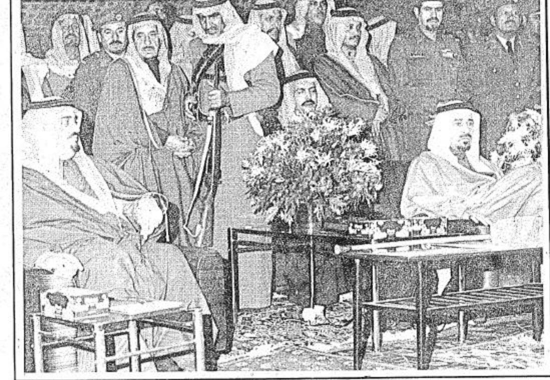
جلالة الاب القائد وولي العهد والنائب الثاني بين حفلة أهل عذيرة

اداء الصلاة في جماعة بعد ذلك ادى جلالة الملك القائد المفدى وأصحاب السمو الامراء والمعالي الوزراء صلاة المغرب في جماعة انشودة من الطلبة وبعد اداء صلاة المغرب وفي جو