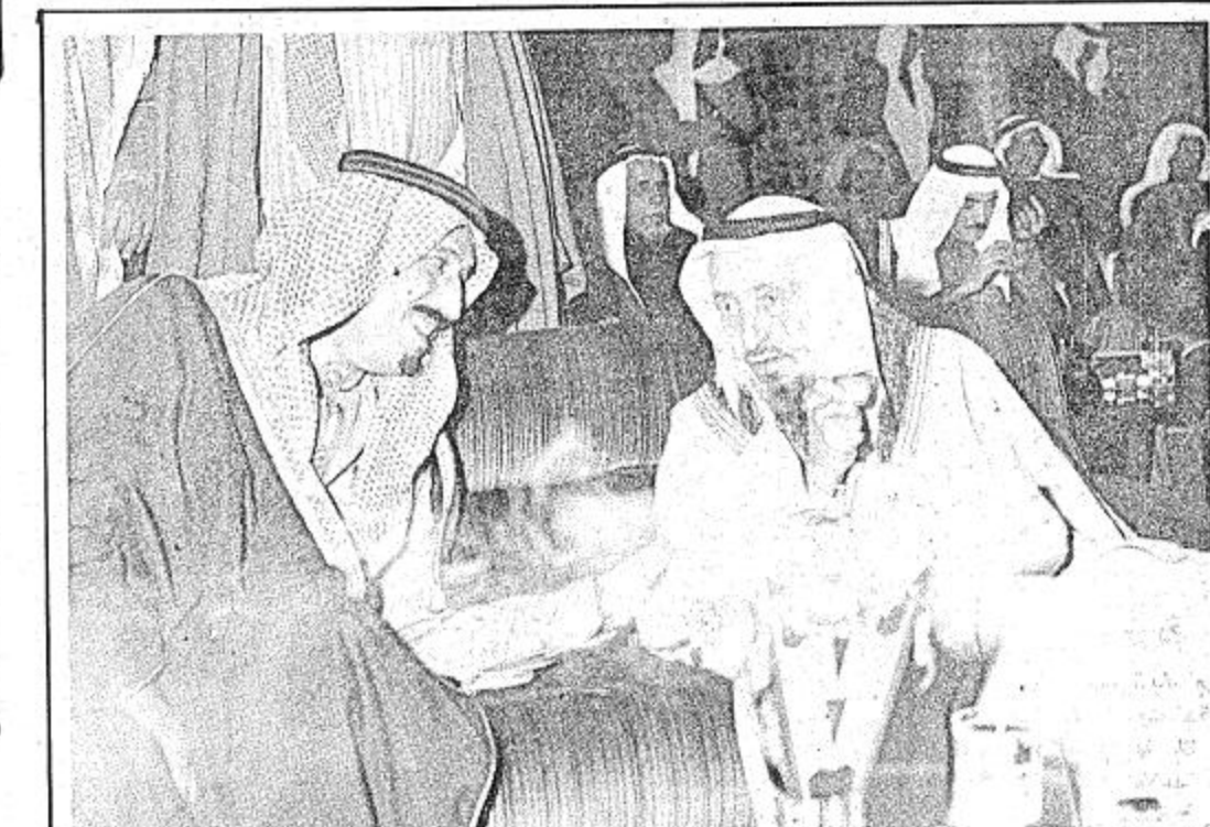
حديث أخوي بين سمو الأمير سلمان أمير الرياض مع أحد اعيان عذيرة