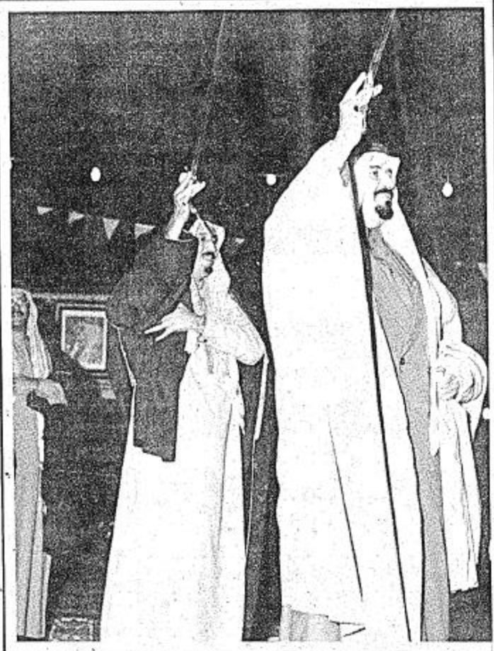
الأميران سلطان وسلطان يشاركان أهالي عذيرة (عذيرة) في العزبة المتحدة

من أصحاب السمو الملكي الأمير عبد الله بن عبد العزيز نائب رئيس مجلس الوزراء ورئيس الحرس الوطني وصاحب السمو الملكي الأمير سلطان بن عبد العزيز وزير الدفاع والطيران، وصاحب السمو الملكي الأمير سلمان بن عبدالعزيز أمير منطقة الرياض.