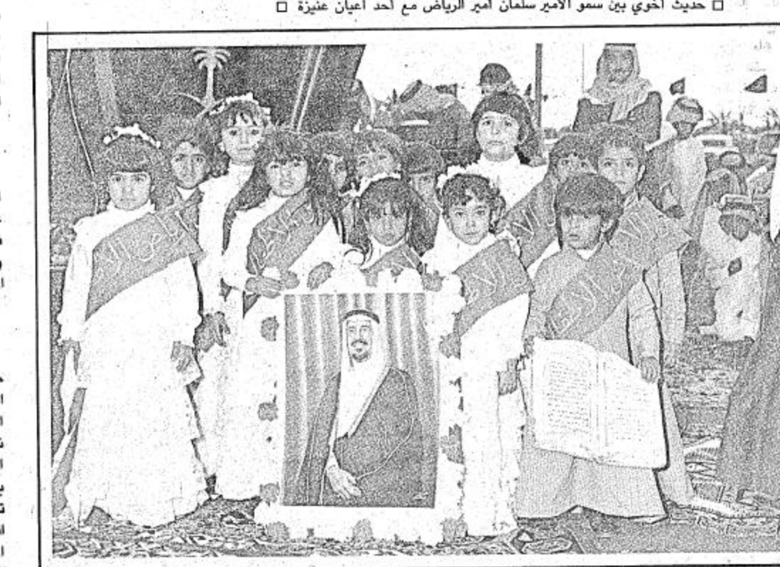
طلبة وطالبات المدارس تتوسطهم صورة الاب الحناني لدى استقبالهم جلالة الملك في عذيرة

الملك يشاهد عرضة نجدية وبعد ذلك تفضل جلالة الملك الاب الحناني والقائد الباني خالد بن عبدالعزيز المفدى بمشاهدة عرضة نجدية القيمة احتفاء بجلالته وترحيبا من اهالي عذيرة نجد بزيارته المباركة.