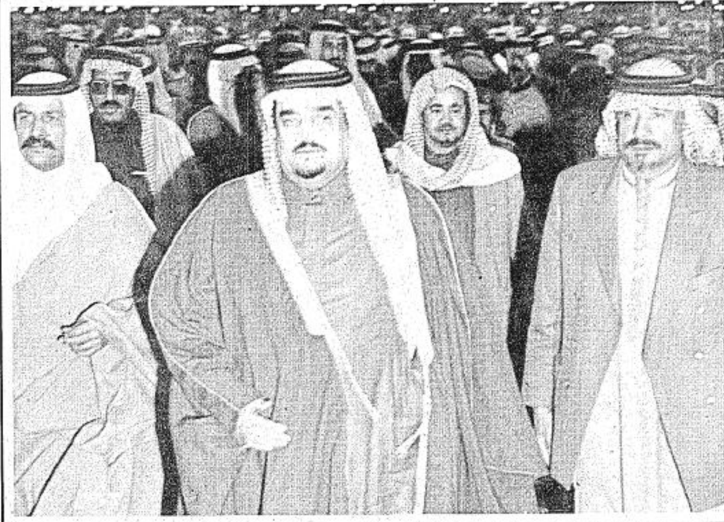
الوفد مع أصحاب السمو الامراء بين اللأاء وعقد الزيارة والحفاوة التي أعدها أهالي مدينة عذيرة الطيبون احتفاء بالملك