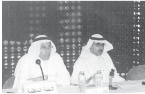
اللجنة المنظمة للمنتدى في إحدى جلساتها

المعلوماتية من اهم خطوة اتخذتها الحكومة في برنامج الخصخصة كانت قبل ٧ سنوات حيث التزمت الدولة بالابتعاد عن الممارسة الاقتصادية كي يستطيع القطاع الخاص القيام بمهامه.