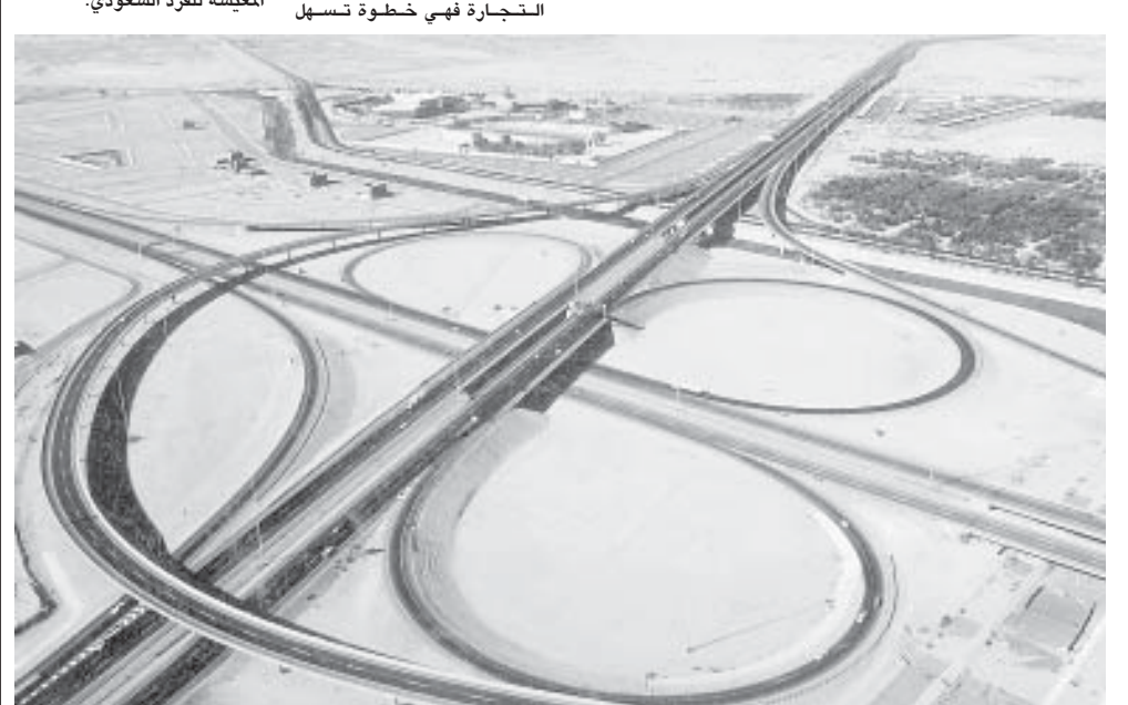
البنية التحتية بحاجة الى التطوير

الاعمال واعداد دراسات عن فرص الاستثمارات المتاحة والملائمة للمرأة السعودية. وشكلت اللجنة المنظمة للمنتدى لجنة نسائية للتحضير للمنتدى سينتاول دور سيدات الاعمال السعوديات والاكاديميات والمهنيات بالشأن الاقتصادي من خلال الشبكة التليفزيونية في تقديم اوراق العمل المتخصصة والمداخلات والأسئلة، والمشاركة في معظم القضايا الاقتصادية التي تهم سيدات الاعمال، ودورها في عملية التنمية الاقتصادية، وعلى خلفية المشاركة الواسعة المتوقعة للمرأة اعطت اللجنة المنظمة اهتماما متعاظما بهذا الامر، واخذت آراء عدد من سيدات الاعمال والاكاديميات حول بعض الموضوعات التي تمثلت في جانب تنمية الاعمال الخاصة للمرأة من خلال تطوير الاطار التشريعي الاجرائي ليعمل سيدات