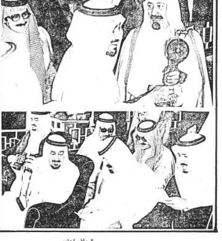
الرياض/ واس شرف جلالته الملك خالد بن عبدالعزيز المفدى حفل سباق الخيل الذي اقامه نادي الفروسية عصر امس على كاس جلالتهم.