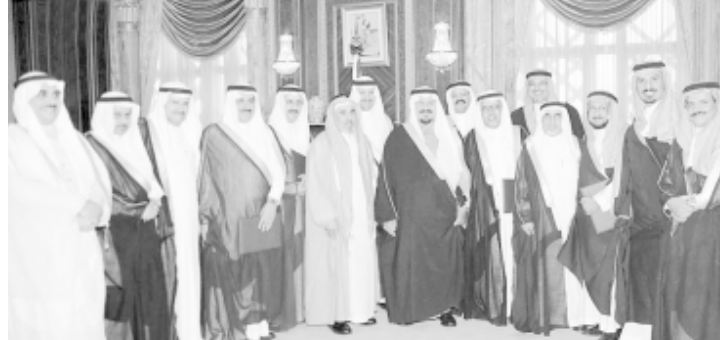
مستقبل العلماء وأعضاء مجلس هيئة السياحة