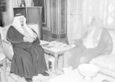
الأمير سلطان خلال استقباله أعضاء مجلس هيئة السياحة