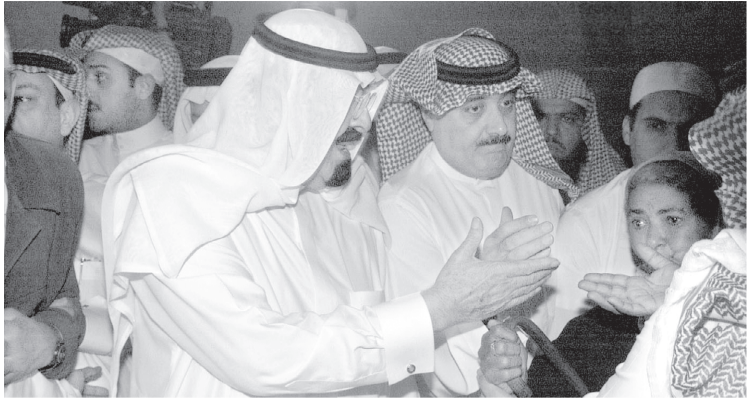
■ سمو ولي العهد خلال جولته التقديرية للأحياء القديمة في الرياض ويظهر - حفظة الله - في حديث (ابوي) مع مجموعة من سكان الحي

الكبرى ليصار الى ترجمتها بعد دراستها الى واقع على الأرض يرى بالأعين المجردة، وهذا ما يحدث بالفعل من خلال هذه الزيارات الميمونة التي تمثل في واقع الامر خير ترجمة للعرف السائد في سياسة القيادة الرشيدة بانتهاج مبدأ الباب المفتوح امام المواطنين، وهو نهج بدأه مؤسس هذه البلاد وباني نهضتها الحديثة الملك عبدالعزيز - طيب الله ثراه - وتمسك بها اشباله الميامين من بعده.. فمرحى لابناء هذه المنطقة بزيارة رمز من رموز القيادة في هذا الوطن المعطاء.. ومرحى لهذه المنطقة بمزيد من مشاريع الخير والعتاء.