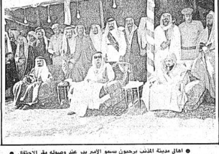
اهالي مدينة المذنب يرحبون بسمو الامير بدر عند وصوله مقر الاحتفال