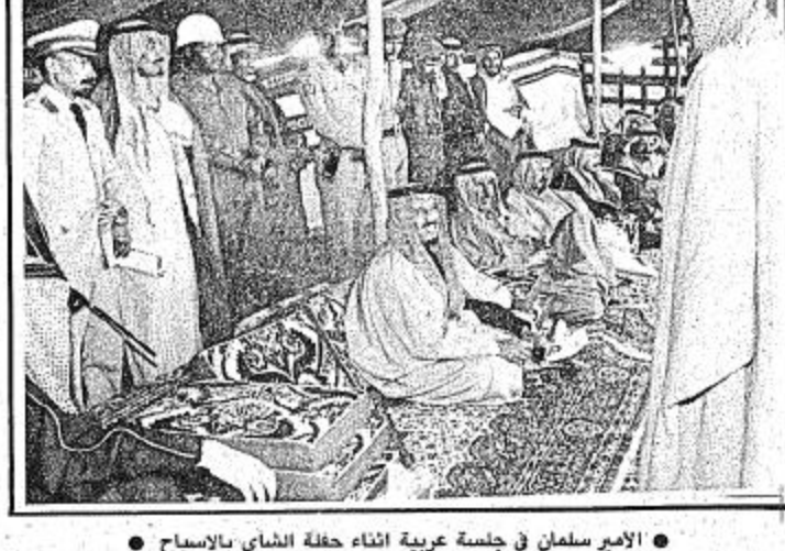
الامير سلمان في جلسة عربية اثناء حفلة الشاي بالاصيل

الامر فهد رسميا قبل وقت قصير الا انها ظهرت بمظهر جميل ومدع قبل وصول سموه اليها. كان امر البدائع الشيخ محمد عبد العزيز المقيم بسروا بتشريف سموه عليه طوال الوقت الذي قضاه سموه بالبدائع وما يذكر ان الشيخ المقيم ضمن اللجنة المنظمة للحفل العام بمنطقة القصيم. تم تغطية حفل البدائع من قبل الاذاعة والصحافة والتلفزيون وقدم الرزبل الاداعي حسن التركي فقرات الحفل الخطابي. اهالي المذنب في الرياض وجدة والمنطقة الشرقية حضروا الى المدينة للمشاركة مع موفقيها.. وقد كان الحفل غاية في الباقة والتنظيم.. ورائعا في الاعداد.. حيث كان مقر الحفل بمساحة ٨٠٠٠ م ٢ . استغرقت الجولة التي قام بها سمو الامير بدر بن عبدالعزيز في شوارع المذنب ٤٠ دقيقة.. وقد زار في خضمها الشيخ محمد الصالح المقيم احد اقدم المشايخ في المدينة. كان يوم امس اجازة لجميع طلاب مدارس المذنب.. الذين تواجدوا في ميدان الحفل.. وقد تمت تغطيته من قبل الاذاعة والتلفزيون. الامر بدر امضى في المدينة اكثر من اربع ساعات حيث وصل الساعة العاشرة.. وغادرها بعد الثانية ظهرا.