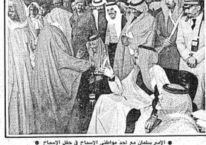
الامير سلمان مع احد مواطني الاصيل في حفل الاصيل