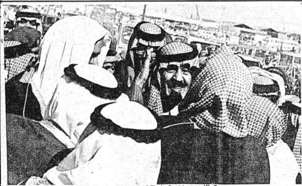
الأمير عبدالله وقد استقبله أهالي البكيرية بالاحضان