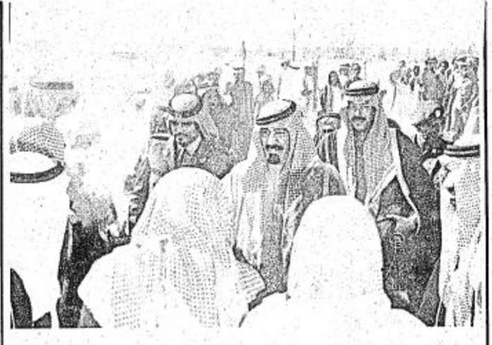
الامير عبدالله لدى وصوله بلدة الهالية