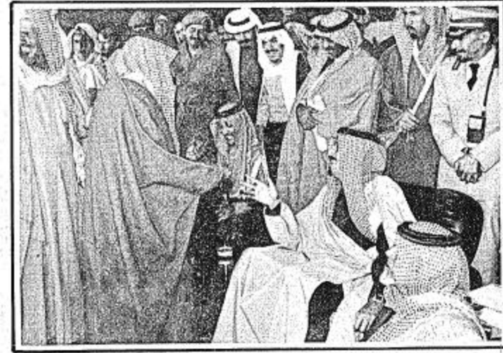
الامير سلمان مع احد مواطني الاصيل في حفل الاصيل