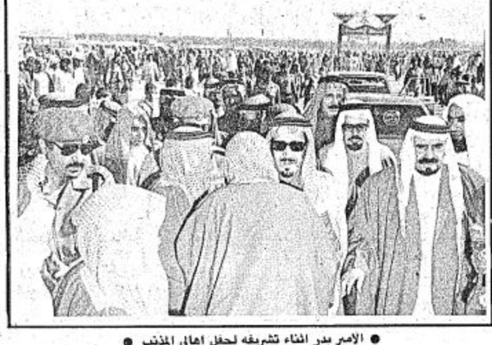
الامير بدر اثناء تشريفه لحفل اهالي المنذب