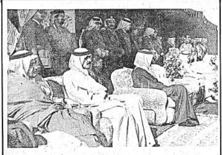
الامير عبدالله بن عبدالعزيز وعدد من اصحاب سمو في مخيم اهالي الشبيجة

يا سيدي يا ولي العهد معذرة عبد العزيز وروض الخلد مسكتكم من قلب نجد بدات السير فانطلقت كنا جماعات اقوام مفرقة يا سيدي يا ولي العهد معذرة عبد العزيز وروض الخلد مسكتكم من قلب نجد بدات السير فانطلقت كنا جماعات اقوام مفرقة