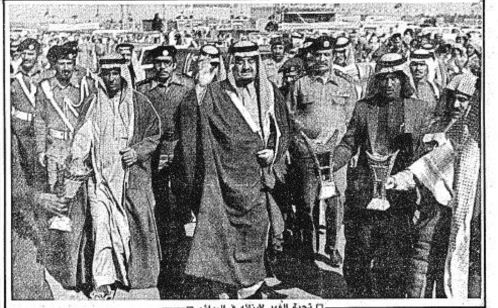
تحية العهد لإيالة في البدائع