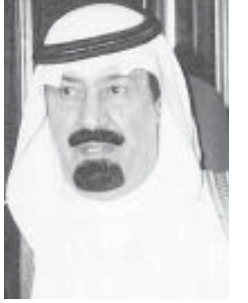
الرياض - علي الزهراني

صدرت موافقة صاحب السمو الملكي الأمير عبدالله بن عبدالعزيز ولي العهد نائب رئيس مجلس الوزراء ورئيس الحرس الوطني على إجراء عملية فصل للسياميتين المصريتين على نفقة سموه بمدينة الملك عبدالعزيز الطبية بالرياض. وأوضح ذلك المدير العام التنفيذي للشؤون الصحية بالحرس الوطني رئيس الفريق الطبي الدكتور عبدالله بن عبدالعزيز الربيعة. وأضاف قائلاً: ان هذه اللقطة من سمو ولي العهد تأتي في سياق مواقف سموه الكريم في تلخيص احتياجات أبناء امته العربية والإسلامية وتقديم كل ما من شأنه تخفيف الآلام وتضميد الجراح معتمداً في ذلك على الله سبحانه وتعالى ثم على الامكانيات الطبية الكبيرة التي تزخر بها من الحرس الوطني الطبية سواء في جدة أو الرياض، حيث تم بحمد الله تحقيق العديد من النجاحات المتميزة، فعلى نطاق عمليات فصل التوائم المتماثلة اجريت ثلاث عمليات فصل بنجاح في مدينة الملك عبدالعزيز الطبية للحرس الوطني الامة.