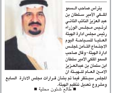
الأمير سلطان يت رأس اليوم اجتماع الهيئة العليا للسياحة

الرياض - واس يت رأس صاحب السمو الملكي الأمير سلطان بن عبدالعزيز النائب الثاني لرئيس مجلس الوزراء رئيس مجلس إدارة الهيئة العليا للسياحة اليوم الاجتماع الثامن لمجلس إدارة الهيئة، وقال صاحب السمو الملكي الأمير سلطان ابن سلمان بن عبدالعزيز الأمين العام للهيئة أن المجلس سينظر فيما تم بشأن قرارات مجلس الإدارة السابع ومشروع تعديل تنظيم الهيئة. ■ طالع شؤون محلية