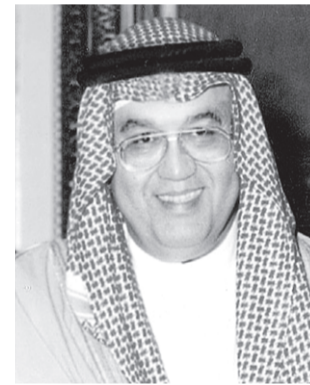
■ د.غازي القصيبي