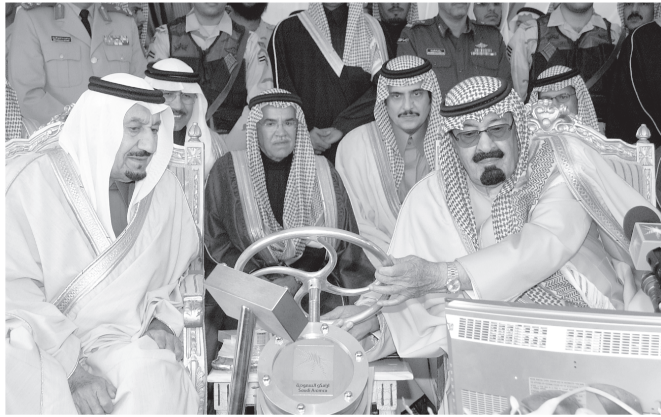
■ سمو ولي العهد يبدن معاملة انتاج النفط بالطريف