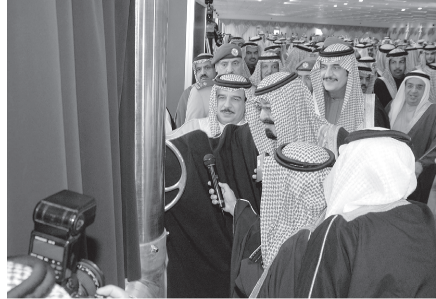
■ سمو ولي العهد يزيج الستار عن مشروع نقل التحلية