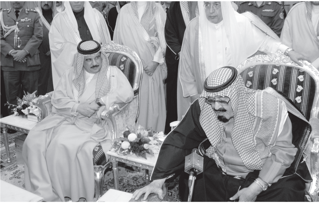
■ سمو ولي العهد يضغط على زر تشغيل المياه الحلاة