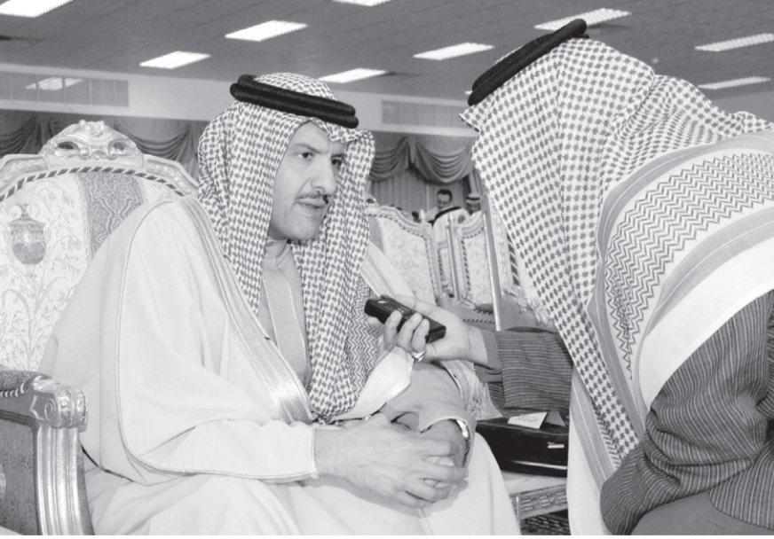
■ الامير سلطان بن سلمان يتحدث لـ «اليوم»