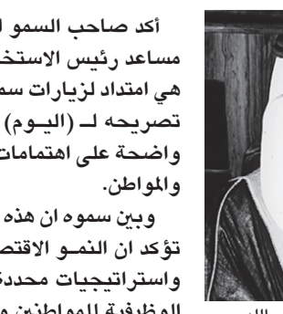
■ الامير فيصل بن عبدالله

أكد صاحب السمو الملكي الامير فيصل بن عبدالله بن محمد آل سعود مساعد رئيس الاستخبارات ان زيارة سمو ولي العهد للمنطقة الشرقية هي امتداد لزيارات سموه المباركة والخيرة لجميع مناطق المملكة وقال في تصريحه لـ (اليوم) ان المشاريع التنموية العملاقة بالمنطقة هي دالة واضحة على اهتمامات حكومتنا الرشيدة - ايدها الله - بكل ما يهم المواطن والوطن. وبين سموه ان هذه المشاريع التي افتتحها سمو سيدي بالمنطقة الشرقية تؤكد ان النمو الاقتصادي في بلادنا - ولله الحمد - يسير وفق خطط واستراتيجيات محددة وسوف تحقق هذه المشروعات التنموية الفرص الوظيفية للمواطنين والعيش الكريم لهم.