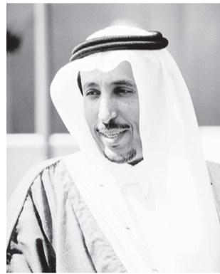
■ الامير سعود بن عبدالله