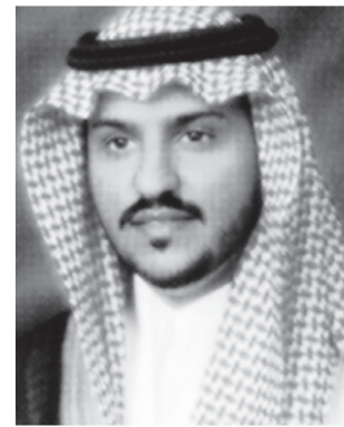
■ الامير بندر بن سلمان