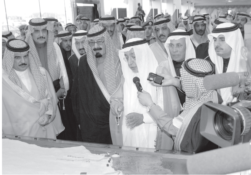
■ سموه يستمع لشرح من الحصين