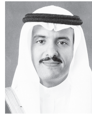
■ الامير سلطان بن سلمان