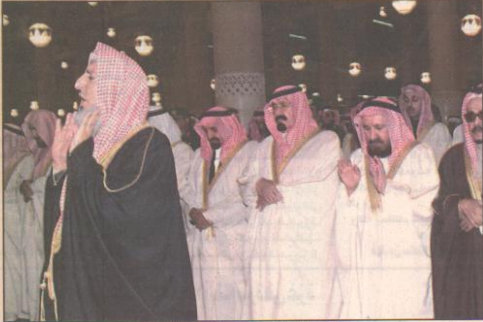
ولي العهد أثناء صلاة العيد بالرياض

مكة المكرمة / المدينة المنورة / الرياض / اليوم / واس أدى المسلمون صباح أمس صلاة عيد الفطر المبارك في مختلف أنحاء المملكة بعد أن من الله عليهم بصيام شهر رمضان المبارك وقيامه. وقد توافد المصلون على مصليات العيد والجامع والمساجد التي هيئت للصلاة في مختلف مدن وقرى ومراكز المملكة منذ الساعات الأولى من الصباح لآداء الصلاة. وشهد الحرمين الشريفان في مكة المكرمة والمدينة المنورة كثافة في عدد المصلين الذين توافدوا إليها. ففي مكة المكرمة أدى خادم الحرمين الشريفين الملك فهد بن عبدالعزيز آل سعود - يحفظه الله - صلاة عيد الفطر المبارك مع جموع المصلين الذين احتشد بهم المسجد الحرام والساحات المحيطة به. وقد أدى الصلاة مع خادم الحرمين الشريفين دولة رئيس وزراء لبنان رفيق الحريري. كما أدى الصلاة مع خادم الحرمين الشريفين صاحب السمو الملكي الأمير سلطان ابن عبدالعزيز النائب الثاني لرئيس مجلس الوزراء وزير الدفاع والطيران والمفتش العام وأصحاب السمو الملكي الأمراء وأصحاب المعالي الوزراء وجموع غفيرة من المصلين. وفي الرياض أدى صاحب السمو الملكي الأمير عبدالله بن عبدالعزيز ولي العهد نائب رئيس مجلس الوزراء ورئيس الحرس الوطني صباح أمس صلاة عيد الفطر المبارك مع جموع المصلين بجامع الإمام تركي بن عبدالله. (طالع ٢) (البقية ص ١٥)