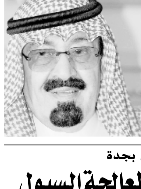
■ تبوك - فائز التمامي تحت رعاية صاحب السمو الملكي الامير عبد الله بن عبدالعزيز ولي العهد نائب رئيس مجلس الوزراء رئيس الحرس الوطني تنطلق يوم الاحد القادم فعاليات ندوة الطفولة المبكرة خصائصها واحتياجاتها التي تنظمها اللجنة الوطنية السعودية للطفولة التابعة لوزارة التربية والتعليم وتستمر لمدة ثلاثة ايام بمركز الملك فهد الثقافي بالرياض.

■ تبوك - فائز التمامي تحت رعاية صاحب السمو الملكي الامير عبد الله بن عبدالعزيز ولي العهد نائب رئيس مجلس الوزراء رئيس الحرس الوطني تنطلق يوم الاحد القادم فعاليات ندوة الطفولة المبكرة خصائصها واحتياجاتها التي تنظمها اللجنة الوطنية السعودية للطفولة التابعة لوزارة التربية والتعليم وتستمر لمدة ثلاثة ايام بمركز الملك فهد الثقافي بالرياض. وستتم في هذه الندوة مناقشة خمسة محاور رئيسية تشمل على: - محور خصائص واحتياجات الطفولة المبكرة. - السياسات والخطط في مجال الطفولة المبكرة. - محور الدراسات والبحوث في مجال الطفولة المبكرة. - البرامج والمشاريع للطفولة المبكرة. - ومحور مؤسسات التنشئة الاجتماعية الادوار والتحديات الذي يشمل المسجد والاسرة والمدرسة