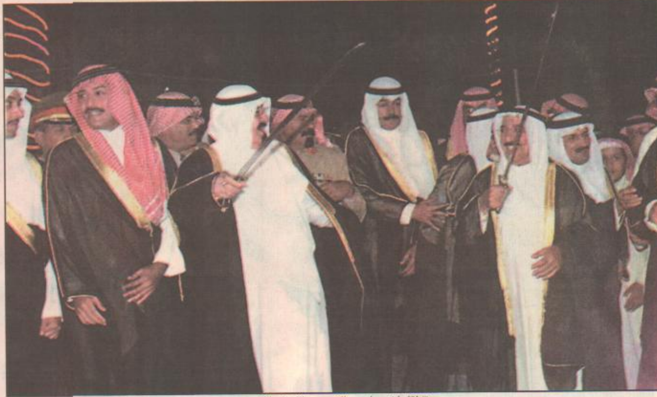
لقاء أخوي لسمو الأمير عبدالله في الكويت