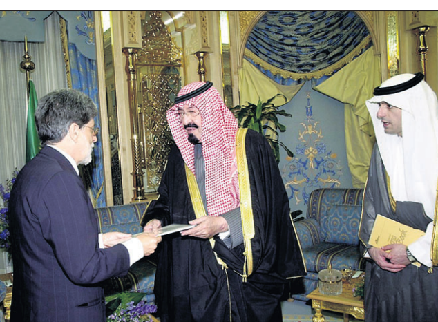
ولي العهد لدى استقباله الوزير البرازيلي «واس»

وتنقل معاليه لصاحب السمو الملكي الامير عبدالله بن