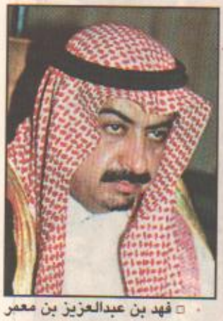
حوار/عبدالعزیز بن جازان رحب محافظ محافظة الطائف فهد بن عبدالعزيز بن معمر باسمه واسم اهالي محافظة الطائف بصاحب السمو الملكي الامير عبدالله بن عبدالعزيز ولي العهد نائب رئيس مجلس الوزراء رئيس الحرس الوطني في زيارته اليمومة للالتقاء باخوانه وابنائهم ورعايته العبد من مشروعات الخير والنماء.

مشروع تلفريك الهدا سيكون له مردود اقتصادي كبير