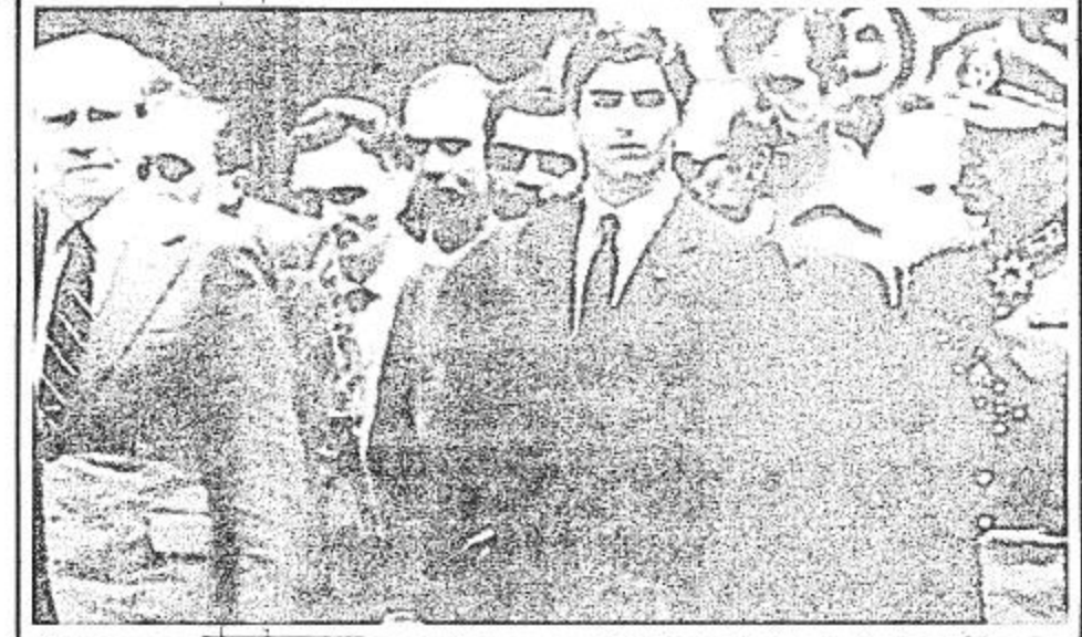
الغنى الذي يحمل جثمان شاه إيران السابق محمداً على دفع الشاه الجنازة العسكرية الرسمية التي خرجت من قصر عابدين وقد لف بالعلم الإيراني