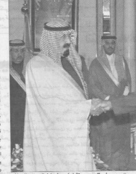
سمو ولي العهد يستقبل أحد ضباط الحرس الوطني