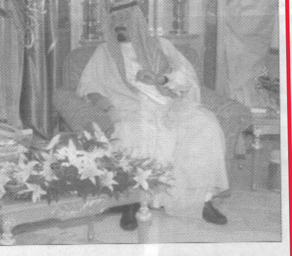
استقبال الرئيس الفلسطيني «واس»