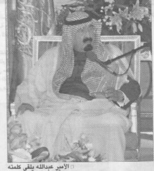
الأمير عبدالله يلقي كلمته

القبض على مرتكبها خلال شهر أوشهرين وله الحمد. وللكم فرجال المباحث العامة يستحقون منكم انتباهاً ومن كل الشعب السعودي وما الشكر والعرفان لهم). وأردف يقول: اننا جزء من العالم نتأثر بما يتأثر به في كافة النواحي ومنها التأحية الاقتصادية التي يتحتم علينا معها شدة الأزمات ليليا حتى تنتهي هذه الضائقة الدولية. وقال سموه في ختام كلمته: (ان كان لدى أحد منكم رأي أو سؤال فانا مستعد للإجابة عليه). عقب ذلك لقي معالي مدير عام المباحث العامة الفريق أول صالح بن طه خفيان كلمة عبر فيها عن سعائته وزملائه منسوبي القطاعات الأمنية ببقاء سمو ولي العهد والاستماع الى توجيهات سموه وإرائته السديدة في مواجهة الأحداث والتطورات التي تشهدها المنطقة والعالم مشيراً الى ان هذه الأحداث والتطورات أكدت صلابه هذه البلاد وتماسك نسيجها الاجتماعي والأمني بفضل الله تعالى ثم بفضل تفك أهل هذه البلاد بعقيدتهم الإسلامية في ظل قيادة المهمة الله الحكمة وبعد النظر وقوة الآراء. وأعرب معاليه عن تشرفه منسوبي القطاعات الأمنية بالقيام بأداء واجبه