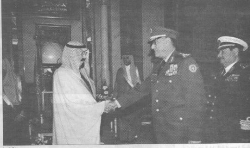
سموه يستقبل ضباط من كافة القطاعات العسكرية

نحن جزء من العالم نتأثر بما يتأثر به في كافة النواحي الفريق الحيا: قطاعاتنا العسكرية تبوأ مركز الصدارة بفضل حرص واهتمام حكومة خادم الحرمين الشريفين الفريق خفيان: الأحداث والتطورات أكدت صلابه البلاد وتماسك نسيجها الاجتماعي