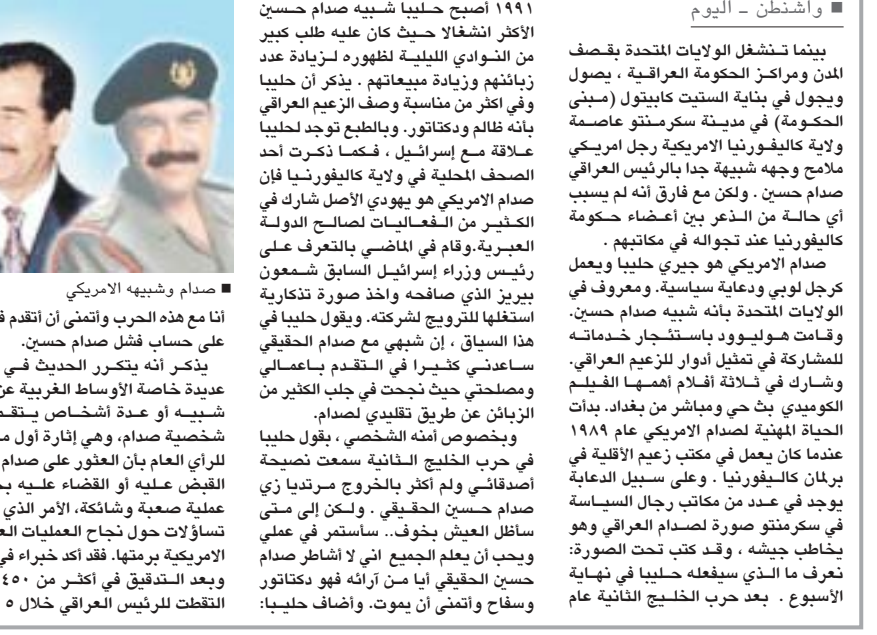
صدام وشبيهه الأمريكي أنا مع هذه الحرب واثمني أن أتقدم في عملي على حساب فشل صدام حسين. يذكر أنه يتكرر الحديث في أوساط عديدة خاصة الأوساط الغربية عن وجود شبية أو عدة أشخاص يتقمصون شخصية صدام، وهي إثارة أول ما توحى للرأي العام بأن العفو عن صدام أو إلغاء القبض عليه أو القضاء عليه بحد ذاته عملية صعبة وشائكة. الأمر الذي قد يغير تساؤلات حول نجاح العمليات العسكرية المتحدة وبريطانيا بالعثور على صدام حسين الحقيقي ستكون صعبة جدا إن لم تكن مستحيلة.

بث مباشر على الهواء» أول أعماله «صدام» الأمريكي.. صورة تذكارية مع بيريز للشهرة أصبح حليبا شبيهه صدام حسين الأكثر انشغالا حيث كان عليه طلب كبير من النوادي الليلية لظهوره لزيادة عدد زبائنهم وزيادة مبيعاتهم. يذكر أن حليبا يفتخر من مناسبة وصف الزعيم العراقي بأنه ظالم وديكتاتور. وبالطبع توجد لحليبا علاقة مع إسرائيل، فكما ذكرت أحد الصحف المحلية في ولاية كاليفورنيا فإن صدام الأمريكي هو يهودي الأصل شارك في الكثير من الفعاليات لصالح الدولة العبرية. وقام في الماضي بالتعرف على رئيس وزراء إسرائيل السابق شمعون بيريز الذي صافحه واخذ صورة تذكارية استغلها للترويج لشركته. ويقول حليبا في هذا السياق، إن شبهي مع صدام الحقيقي ساعدني كثيرا في التقدم باعمالتي ومصلحتي حيث نجحت في جلب الكثير من الزبائن عن طريق تقليدي لصدام. وبخصوص أمني الشخصي، يقول حليبا في حرب الخليج الثانية سمعت نصيحة أصدقائي ولم أكثر بالخروج مرتديا زي صدام حسين الحقيقي.. ولكن إلى متى ساطل العيش بخوف.. ساستمر في عملي ويجب أن يعلم الجميع أنني لا أشاطر صدام حسين الحقيقي أيا من آرائه فهو ديكتاتور وسفاح واثمني أن يموت. وأضاف حليبا: