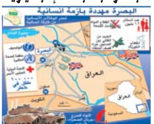
البصرة مهددة بازمة إنسانية لندن - الكوكلات