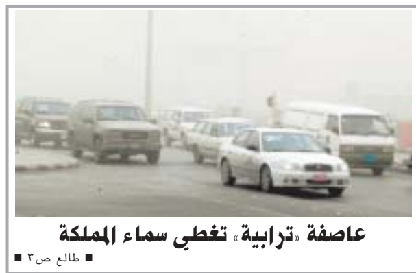
عاصفة ترابية تغطي سماء المملكة طالع ص ٣

الجوف - سامي الخليفة ألقت قوات شرطة منطقة الجوف القبض على مرتكب جريمة إطلاق النار على دورية المرور بمدينة سكاكا يوم أمس الأول والتي نتجت عنها وفاة أحد أفراد المرور وإصابة زميله الآخر عقب انتهائهما من عملهما بتسهيل حركة السير عند إحدى المدارس.