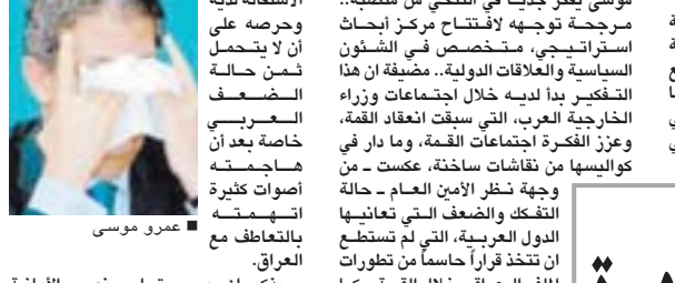
عمرو موسى العراق

وكشفت مصادر لـ «اليوم» أن عمرو موسى يفكر جديدا في التنحي من منصبه.. مرجحة توجهه لافتتاح مركز أبحاث استراتيجي، متخصص في الشؤون السياسية والعلاقات الدولية. مضيفة أن هذا التفكير بدأ لديه خلال اجتماعات وزراء الخارجية العرب، التي سبقت انعقاد القمة، وعزز الفكرة اجتماعات القمة، وما دار في كواليسها من نقاشات ساخنة، عكست من وجهة نظر الأمين العام - حالة التفكك والضعف التي تعانيها الدول العربية، التي لم تستطع أن تتخذ قرارا حاسما من تطورات الملك العراقي خلال القمة.. كما ذكرت المصادر أن ما جرى بين القويدين العراقي والكويتي من مفاوضات في قمة الدول العربية التي عقدت خلال شهر مارس ٢٠٠٢، خلفا لمواطنه عصمت عبدالمجيد.