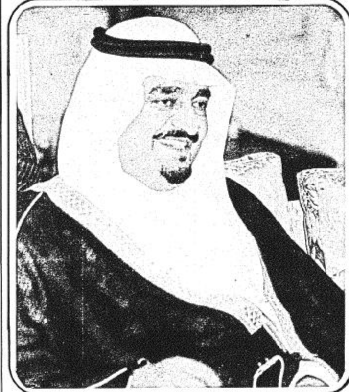
الامير فهد بن عبد العزيز في زيارة للمملكة العربية السعودية.

وقال سموه ان القوى الصهيونية تحاول شغلنا والهائنا لصرفنا عن الخط الذي اخذناه الى جانب امتنا وقضاياها العادلة.. كما تناول سموه في حديثه عددا من القضايا الهامة التي تشغل الراي العام في الداخل والخارج..