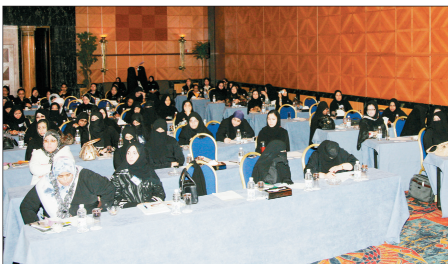
مشاركة نسائية واسعة في ندوة جدة للطب النفسي في مستشفى باقرو والدكتور عرفان في جدة أمس.

بحث ندوة جدة التاسعة للطب النفسي التي نظمتها مستشفى باقرو والدكتور عرفان بعنوان ( تكامل العلاجات البيولوجية والنفسية ) العلاج النفسي من خلال الفن التشكيلي . وتهدف الندوة التي ترأسها الدكتور محمد عرفان على مدى اليومين الماضيين إلى العمل على تقديم أفضل رعاية للمريض النفسي، وبناء جسور التعاون بين الأطباء النفسيين حول العالم وخصوصا في العالم النامي والمنطقة العربية. شارك في الندوة عدد من المختصين والخبراء في الطب النفسي وبعض رجال الدين، حيث تم تقديم أوراق عمل حول الفقه الطبي الذي يتماشى جانباً إلى جانب مع فقه العبادات وفقه المعاملات وفقه الأئمة. وطرح الدكتور عبدالله فدعق رؤية وأهداف جمعية أصدقاء مرض الزهايمر الخيرية في منطقة مكة المكرمة. كما تحدث الدكتور محمد فخر الإسلام عن الثقافة المجتمعية والعناية بالصحة النفسية، وطرح الدكتور أحمد سعد علي مدرس الطب النفسي في مستشفى باقرو رئيس اللجنة العلمية للندوة أهم الجوانب المتعلقة بالندوة وأبرز أهدافها العلمية والتطبيقية.