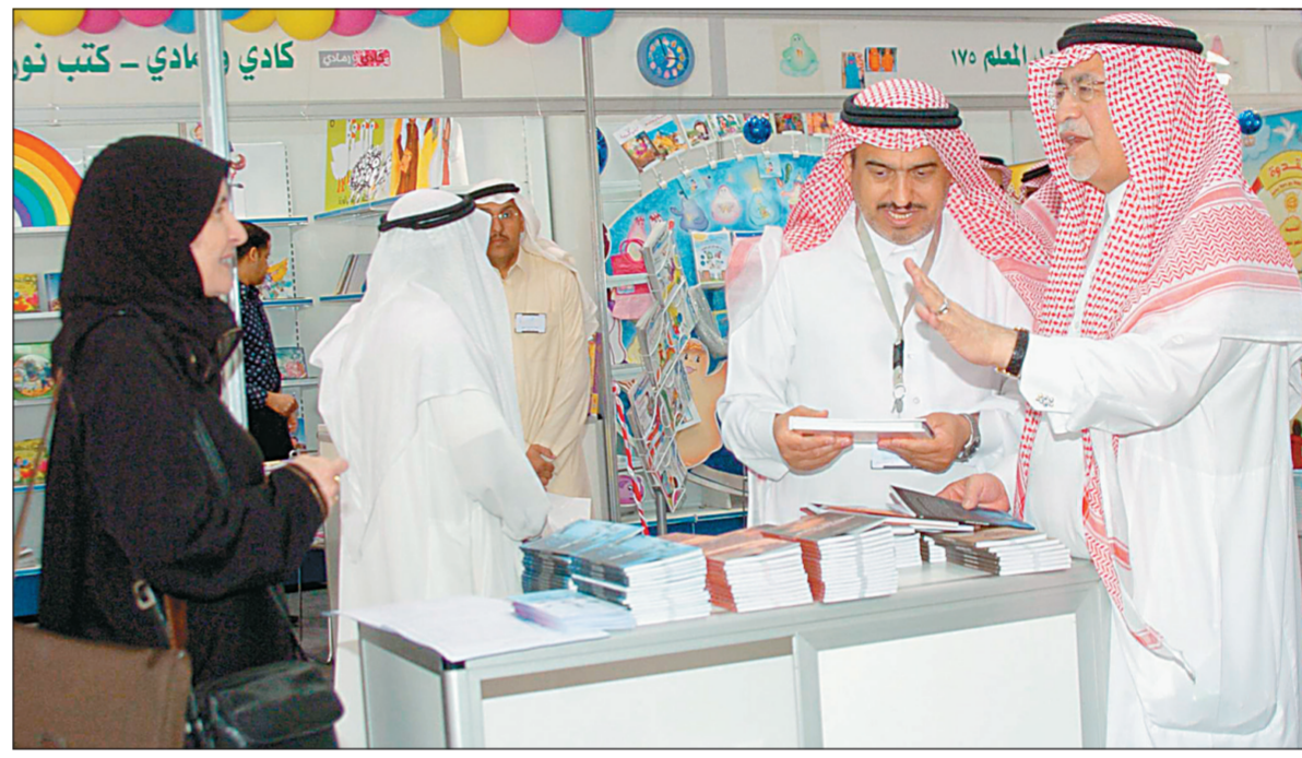
الوزير د. عبدالعزيز خوجة يتحدث لرائدة في معرض الكتاب الدولي في الرياض أمس. ويبدو الدكتور عبدالعزيز السبيل وكيل وزارة الثقافة والاعلام للشؤون الثقافية.

المجتمع وأن النجاحات التي يحققها المعرض تظهر في الأعداد الكبيرة من الزوار. ورغم بعض التساؤلات من الزوار عن بعض أسعار الكتب إلا أنها لا تمثل إزعاجا من مراد المعرض بعد أن أضاف المسؤولون جناحا للكتب المستعملة والتي لاقت رواجاً من الزوار خاصة أنها تركزت على بيع القصص والروايات والكتب التاريخية وبلغت نسبة المبيعات ٤٠٪ وفق ما ذكره أحد مسؤولي تلك الأجنحة. ويраهن المتابعون أن تحقق الأيام العشرة من مدة المعرض أرقاما قياسية من الزوار والمبيعات قياسا على المشهد الثقافي الذي كان حاضرا وافتتقا في اليومين الماضيين من إقامة المعرض.