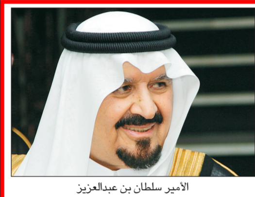
الأمير سلطان بن عبدالعزيز