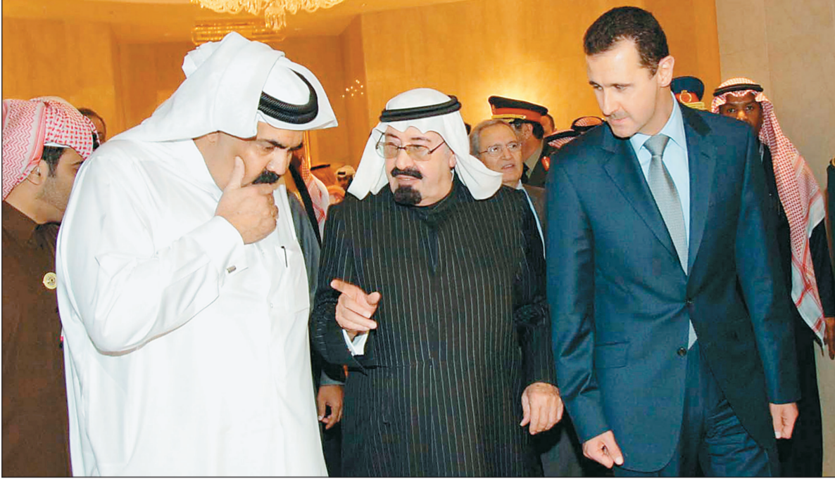
حكمة الملك عبدالله حولت الخلافات إلى إجماع عربي في قمة الكويت.