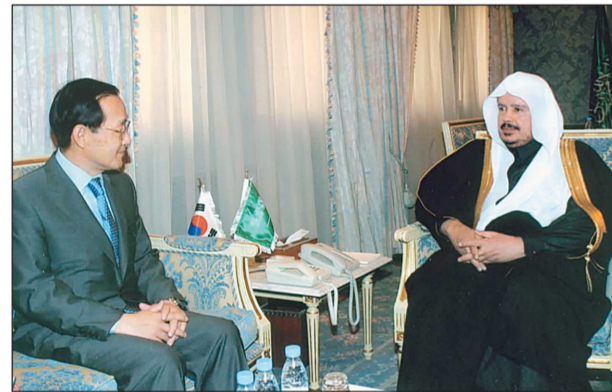
د. عبد الله آل الشيخ مستقبلاً السفير هونغ جونج أمس في الرياض.

واس - الرياض ناقش وزير العدل الدكتور عبد الله بن محمد آل الشيخ في مكتبه في الوزارة أمس مع سفير جمهورية كوريا الجنوبية لدى المملكة هونغ جونج كي، الموضوعات ذات الاهتمام المشترك بين البلدين الصديقين.