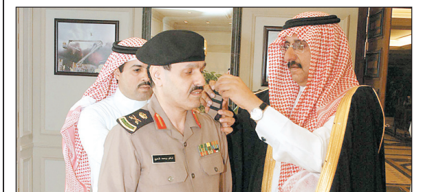
الأمير محمد بن نايف يقبل إبراهيم الحرج رتبته الجديدة.