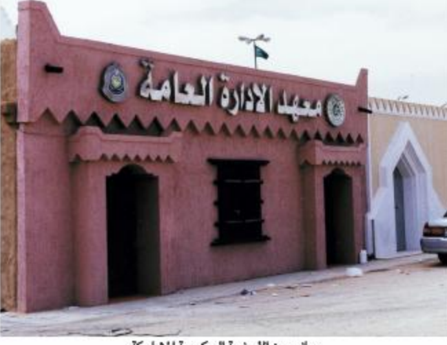
جانب من الأجنحة الحكومية المشاركة