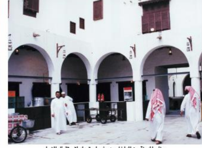
جناح المدينة من الداخل وهو في استعداد لاستقبال الزوار