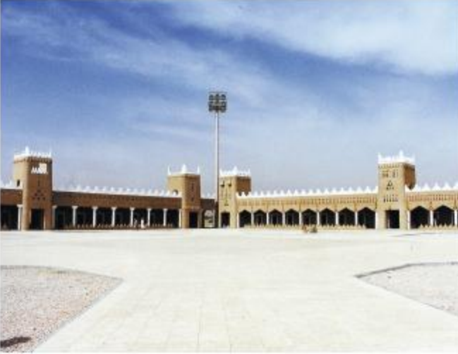
ساحة العرض في جناح القصيم

يرتب الصاملون فيه أرفق الكتب ودور النشر والطباعة، معرض الكتاب الذي يكتظ من كثرة الزوار الذين يتهاقون إلى الحصول على القصص الأدبية والروايات للشوكة لتنمية مفرداتهم اللغوية وتنمية مخيلاتهم الذهنية وفتح آفاق كبيرة أمام زوار المعرض. الجناح الأكثر زواراً على طول فترة مهرجان الجنادرية وهو جناح المدينة المنورة الذي يحتضن في كل عام زوار يتجاوزون الآلاف وقد تميز جناح المدينة باكلاته الشعبية والروائح الزكية التي يشتمها داخل الجناح وكذلك ماء الزير المعطر بماء الورد ليروي عطش الزائر وكذلك هناك الأكلات الشعبية والمشروبات التي عرفت عن جناح المدينة ولا