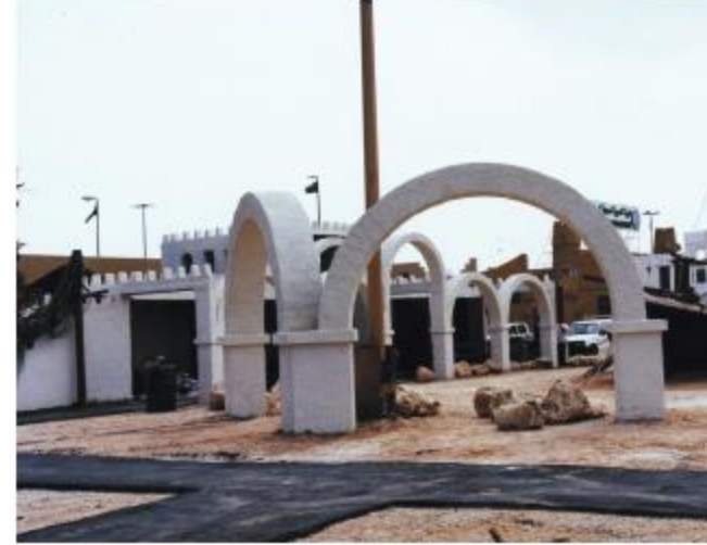
الزفلة داخل قسم الأجنحة الحكومية