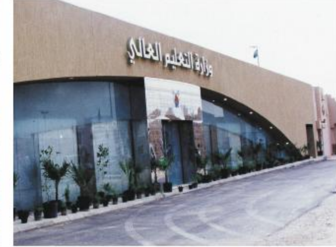
جناح وزارة التعليم العالي