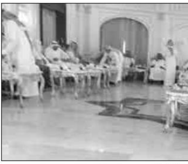
مهافظ المذنب يستقبل المهتئين