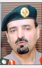
الفريق سعيد القحطاني

تكليفهم بتنفيذ الخطط والتركيز في ذلك على القوات المساندة قبل توجهها إلى المشاعر المقدسة من مناطق أعمالها العسكرية وأن يتم تعريف المساندين بواجباتهم الميدانية في مواقع أعمالهم عند مباشرتهم لمهامهم في مكة المكرمة وتزويدهم بكل ما يتطلبه تنفيذ الخطة من الوسائل المساعدة للتواصل مع الحجاج وتزويدهم بالإرشادات المساعدة لهم.