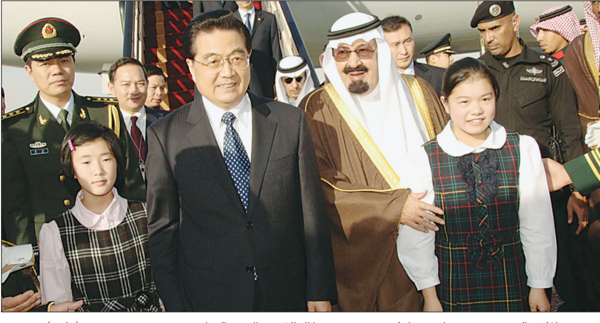
الملك والرئيس هو جينتاو مع طفلتين صينيتين خلال الاستقبال في الرياض.