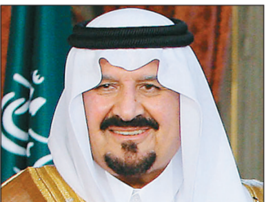
الأمير سلطان بن عبدالعزيز

تلقى صاحب السمو الملكي الأمير سلطان بن عبدالعزيز ولي العهد نائب رئيس مجلس الوزراء وزير الدفاع والطيران والمفتش العام رسالة من فخامة رئيس بوركينا فاسو بلاين كومباور . تسلم الرسالة نيابة عن ولي العهد الأمير الدكتور مشعل بن عبدالله بن مساعد مستشار ولي العهد لدى استقباله أمس سفير بوركينا فاسو لدى المملكة عمر داواروا في مكتب وزير الدفاع والطيران والمفتش العام في الرياض.