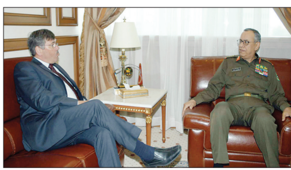
الفريق الأول الركن صالح المحيا مستقبلا وزير الدولة لشؤون القوات المسلحة البريطانية بوب انسورث أمس في الرياض. (واس)

بحث رئيس هيئة الأركان العامة الفريق الأول الركن صالح بن علي المحيا في مكتبه في وزارة الدفاع والطيران أمس مع وزير الدولة لشؤون القوات المسلحة البريطانية السيد بوب انسورث الذي يقوم بزيارة رسمية للمملكة، عددا من المواضيع ذات الاهتمام المشترك.