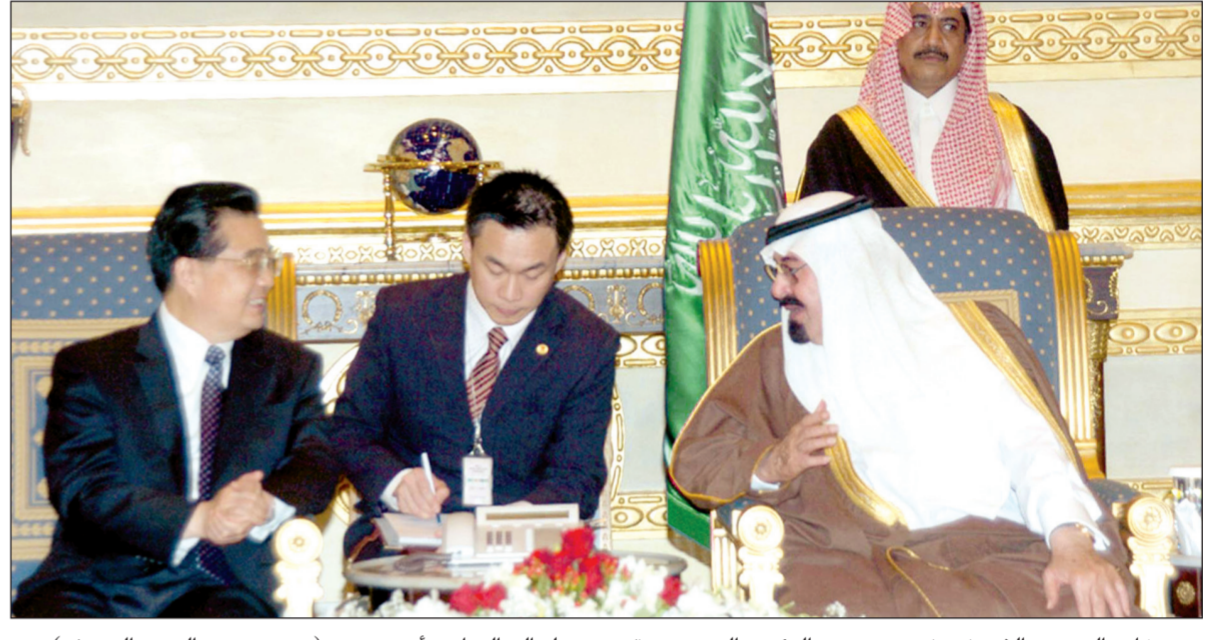
خادم الحرمين الشريفين في حديث مع الرئيس الصيني عقب وصوله إلى الرياض أمس.

قد بحثا مجمل المستجدات على الساحة الإقليمية وفي مقدمتها تطورات القضية الفلسطينية، وأهمية تحقيق سلام عادل وشامل يضمن للشعب الفلسطيني حقه في إقامة دولته المستقلة والقابلة للحياة.