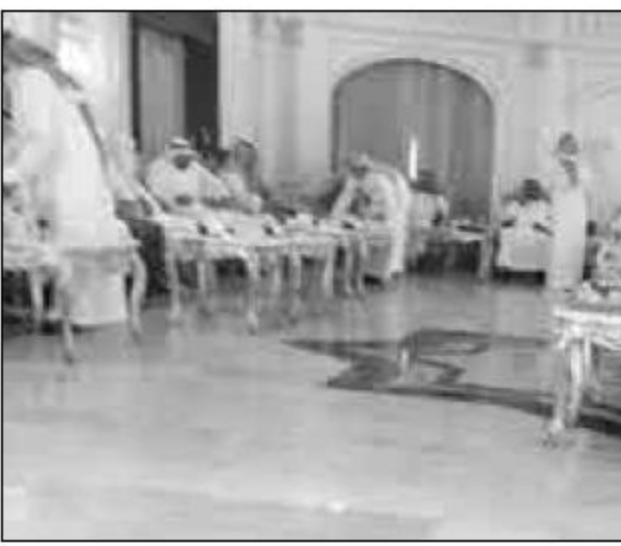
مخاطف المذنب يستقبل المهنتين