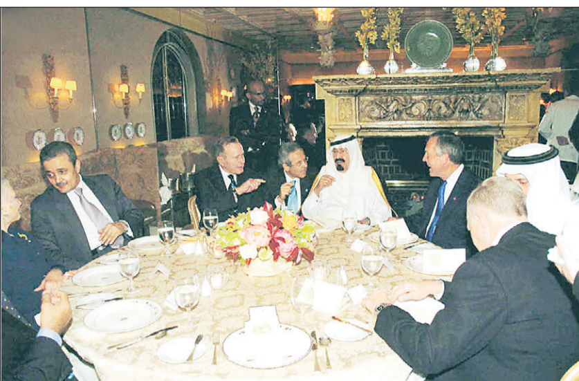
سمو ولي العهد على مائدة بوش الأب

الدعوة الأهمية التي يعلقها بوش على التحالف مع المملكة التي تعد الدولة الأولى في تصدير النفط على مستوى العالم والعضو البارز في منظمة وياتي اجتماع الأمير عبد الله مع بوش في مزرعته بعد أسبوعين من زيارة رئيس الوزراء الإسرائيلي إرييل شارون التي حذر بوش خلالها شارون من توسيع المستوطنات في الضفة الغربية. وفي عام 2002 طرح الأمير عبد الله اقتراحاً لإنهاء العنف في الشرق الأوسط بدعوة الدول العربية لتطبيع العلاقات مع إسرائيل في مقابل الانسحاب من الأراضي العربية المحتلة في حرب 1967. ورفضت إسرائيل فكرة الانسحاب الكامل. وينتظر أن يطرح الأمير عبد الله على بوش أن يكون ذلك الاقتراح جزءاً من خارطة الطريق.