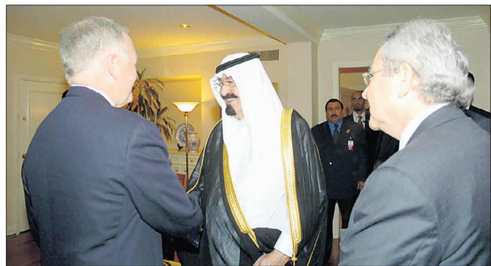
سمو ولي العهد يستقبل رئيس شركة هنت للبتترول

بشكل عام والشأن الخليجي بشكل خاص من نواح اقتصادية واستثمارية بالطبع.