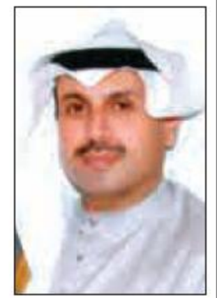
حمد جابر العلي الصباح

و للشعب السعودي، وكان في استقباله في مطار قاعدة الرياض الجوية صاحب السمو الملكي الأمير فهد بن سلطان بن عبد العزيز أمير منطقة الرياض، ومعالي وكيل