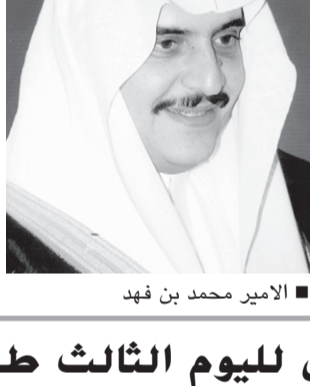
الامير محمد بن فهد

رعاية صاحب السمو الملكي الأمير محمد بن فهد بن عبدالعزيز امير المنطقة الشرقية تطلق الهيئة السعودية للمهندسين وأمانة مدينة الدمام الحملة الأولى للوعي البيئي في الضامن والشرايين من ذي القعدة الجاري وتستمر الى الضامن من ذي الحجة في جميع مدن ومحافظات المنطقة الشرقية. وتمن امين مدينة الدمام رئيس اللجنة العليا المنظمة المهندس ابراهيم سليمان بالغنيم اهتمام امير المنطقة الشرقية على نشر الوعي البيئي وحرص سموه على كل من شأنه المحافظة على البيئة وما يرتب عليه من جوانب ايجابية تساعد الانسان على العيش في بيئة صحية وسليمة. كما حث بالغنيم كافة الجهات على تفعيل دورها في المشاركة في فعاليات الحملة تماشيا مع توجيهات حكومة خادم الحرمين الشريفين في المحافظة على البيئة والترتين على التوعية البيئية كأحد اهم العوامل المساعدة للمحافظة على المكتسبات الطبيعية في بلادنا. وتتضمن الحملة اقامة الندوات والمحاضرات والمعارض والسباقات المختلفة للتعريف بأهمية المحافظة على البيئة من خلال التركيز على التوعية. كما تستقطب الحملة عددا من المختصين بالجوانب البيئية للتحدث حول قضايا البيئة المختلفة.