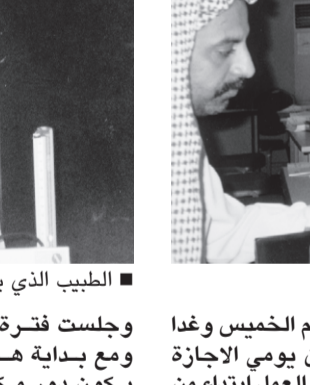
الطبيب الذي يباشر الحالات الطارئة