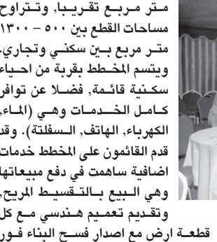
التواجد الامني امام بوابة المعهد