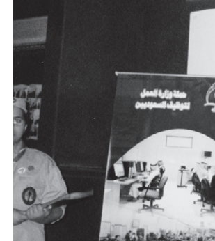
الحضور الكشفي في مدخل المسرح

المخطط تصل الى حدود ٧٧٥٠١ متر مربع تقريبا. وتتراوح مساحات القطع بين ٥٠٠ - ١٣٠٠ متر مربع بين سكني وتجاري. ويتسم المخطط بقرية من احياء سكنية قائمة. فضلا عن توافر كامل الخدمات وهي (الماء) الكهرباء، الهاتف، السفلة). وقد قدم القانوم على المخطط خدمات اضافية ساهمت في دفع مبيعاتها وهي البيع بالتقسيط المره، وتقديم تعميم هندي مع كل قطعة ارض مع اصدار فسخ البناء فور استكمال الاجراءات. بالإضافة الى تقديم خدمة البناء كمن يريد.