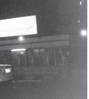
التواجد الامني امام بوابة المعهد