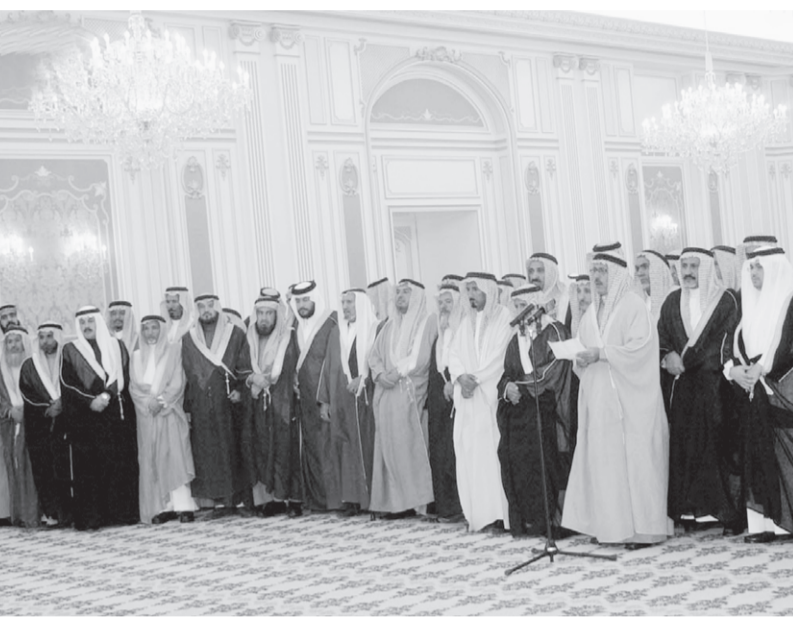
وفود قبائل تستنكر امام سمو ولي العهد عمليات الإرهاب

في الديوان الملكي الشيخ ناصر الشثري ومعالى المستشار في ديوان سمو ولي العهد الاستاذ عبدالمحسن بن عبدالعزيز التوجيهي.