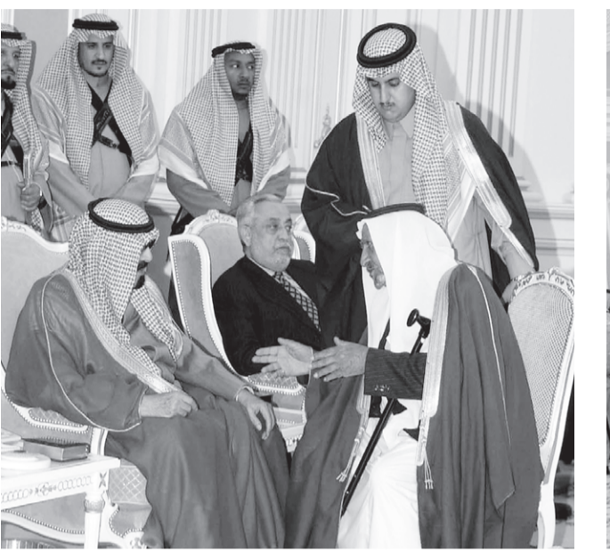
الأمير عبدالله يستقبل جمعا من المواطنين