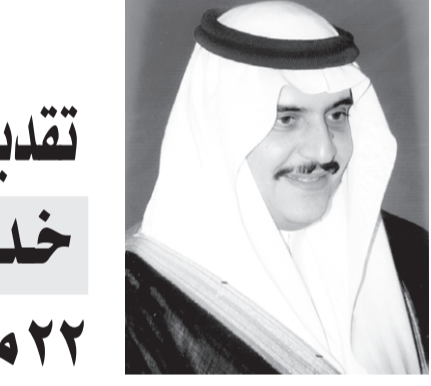
الدمام - عبدالله الغشري

الدمام - عبدالله الغشري يفتتح صاحب السمو الملكي الامير محمد بن فهد بن عبدالعزيز أمير المنطقة الشرقية ظهر اليوم المركز الشامل لخدمات الجمهور بامارة المنطقة الشرقية وذلك بعد الانتهاء من تنفيذه بمتابعة سمو أمير المنطقة الشرقية وسمو نائبه صاحب السمو الأمير جلوي بن عبدالعزيز بن مساعد. وأوضح ذلك وكيل امانة المنطقة الشرقية الأستاذ سعد بن عبدالعزيز العمشان وقال: ان المركز يهدف الى زيادة استثمار الوقت وتقديم خدمة مميزة وسريعة للمستفيدين سواء كان مواطنا أو مقبما بحيث يوفر على المراجعين مراجعة مختلف الادارات في الامارة في وقت واحد بإيجاد ممثلين عن مختلف الادارات في ادارة واحدة. حيث نسعى من خلال هذا المركز