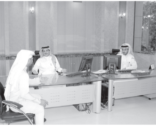
لقطات من صالات المركز

معاملاتهن لكن ستقدم خدمات اخرى عن طريق المركز بحيث تحصل طالبات المتقدّمات الى الجهات المختصة والادارات المختلفة وسيتم