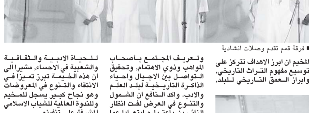
فرقة قم تقدم وصلات انشادية

للحياة الادبية والثقافية والشعبية في الاحساء. وسبقها في ان هذه الخيمة تبرز تميزا في الانتقاء والتنوع في العروض والادب. واكد النافع ان الشموخ والتنوع في العرض لفت انظار الزائرين بأعنياره ابتعادا عما تفعله بعض المعارض التاريخية، التي تحضر الارث التاريخي في الموروث الاجتماعي وحده فيما ابرزت الخيمة عمق وشمول الارث التاريخي للاحساء. واضاف النافع في الخيمة التراث الزراعي والاجتماعي والمسكوكات والمقتنيات ولوحات الخط العربي والرسوم الفنية والصور القديمة والمؤلفات والمطبوعات الاولى للكتب والمناهج الدراسية. وجمع بين المؤسسات الرسمية المهتمّة بالتراث كما تبرز جهود الاهالي والمهتمين بالإضافة الى اجحة الامسيات والندوات الثقافية والادبية التي تحكي الصور الخفية والوجه الحقيقي