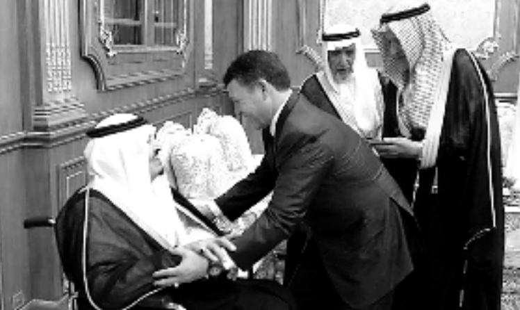
خادم الحرمين الشريفين وملك عبدالله الثاني خلال اللقاء

خادم الحرمين الشريفين يهنئ كرزاي مكة المكرمة - واس بعث خادم الحرمين الشريفين الملك فهد بن عبدالعزيز آل سعود برقية تهنئة ل فخامة الرئيس حامد كرزاي رئيس دولة أفغانستان الانتقالية الإسلامية بمناسبة فوزه في الانتخابات الرئاسية الأفغانية، وأعرب الملك المغدى عن بالغ التهنئة على الثقة التي أولاها أيها الشعب الأفغاني متمنياً لفخامته التوفيق وتحقيق الأمن والرخاء لبلاده. ونوه - أبده الله - بهذه المناسبة بالعلاقات الطيبة القائمة بين البلدين والشعبين الشقيقين وما يتطلع إليه الجميع من تمتتها.