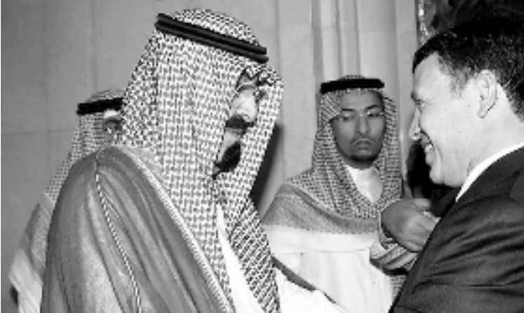
سمو ولي العهد يستقبل عاهل الأردن