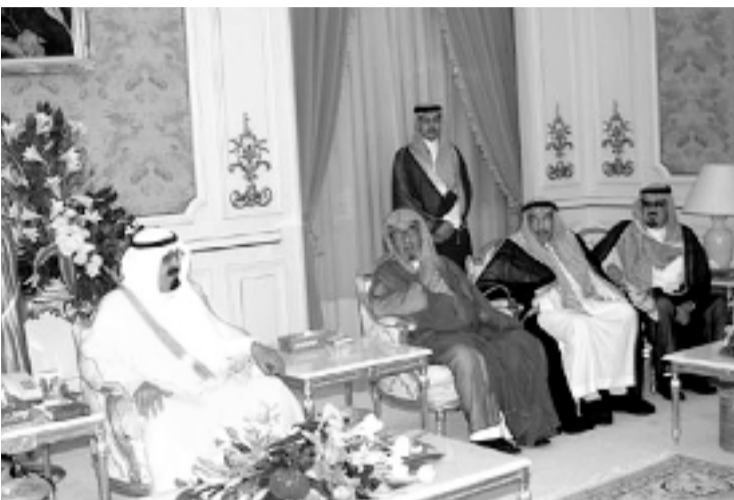
جانب من استقبالات سمو ولي العهد

استقبل صاحب السمو الملكي الأمير عبدالله بن عبدالعزيز ولي العهد نائب رئيس مجلس الوزراء رئيس الحرس الوطني في الديوان الملكي بقصر السلام أمس أصحاب السمو الملكي الأمراء وأصحاب المعالي الوزراء وكبار المسؤولين وجما من المواطنين الذين قدموا للسلام على سموه. كما استقبل صاحب السمو الملكي الأمير عبد الله بن عبد العزيز وفداً من الأشراف آل غالب يقدمهم الشريف محمود بن محسن آل غالب الذين قدموا لسمو ولي العهد وثيقة تاريخية عبارة عن رسالة من الإمام سعود بن عبد العزيز هي بيان منحه الدولة السعودية الأولى في العقيدة ويوجد عليها توقيع الشريف غالب بن مساعد وذلك بتاريخ ١٢٢٥هـ بصورة مرسوم ملكي أصدره جلالة الملك عبدالعزيز رحمه الله بصدده الشريف شرف بن أحمد عدنان آل غالب رئيساً لجلس الشورى عام ١٣٤٤هـ وكتيباً عن أول مؤتمر إسلامي دعا إليه