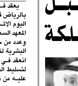
د. أحمد الرشيد

استقبل وزير التربية والتعليم الدكتور محمد بن احمد الرشيد صباح امس الأحد بمكتبه بالوزارة سفير الجمهورية التركية لدى المملكة السيد اوفردوغان. كما استقبل في اليوم نفسه سفير الجمهورية الباكستانية لدى المملكة السيد عبدالعزيز ميرزا، حيث دار خلال اللقاءين استعراض جوانب من العلاقات المتنامية بين المملكة العربية السعودية والبلدين الشقيقتين في كافة الجوانب التنموية وطرق الحديث التي جملة من الموضوعات التربوية والتعليمية حول مدارس البلدين في المملكة، بالإضافة الى سبل الاستفادة من الخبرات والتجارب التربوية وتدعيم التعاون المشترك.