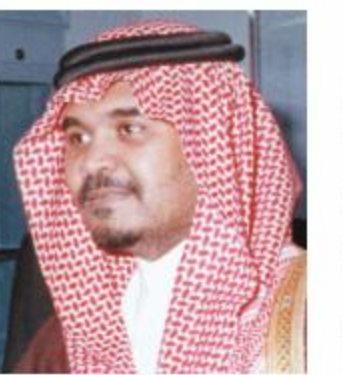
صاحب السمو الملكي الأمير بندر بن سلطان بن عبد العزيز سفيراً للمملكة العربية السعودية في الولايات المتحدة الأمريكية التي