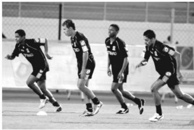
فريق الاتحاد (تدريبات)

الصحف ولكن إجمالاً لم تكن محظوظين في تلك المباراة. أما أشام الوحدة فقد لعبنا أيضاً بشكل جيد ولاحت عدة فرص عن طريق هيريرا والسويد وسيرجيو ولو سجلت تلك الفرص لفرزنا بنتيجة كبيرة ولكن هذه كرة القدم وقانونها يقول إذا لم تسجل من إصناف الفرص فإن مرماك سيكون معرضاً للتسجيل وأنا في تلك المباراة لم أكن راضياً عن اللاعبين خصوصاً وأن لديهم خبرة وكان يجب عليهم المحافظة على الكرة من خلال الإخطاء الاحترافية لاستهلاك الوقت الفصير المتبقي من عمر المباراة الذي كان يفصلنا عن تحقيق الفوز.