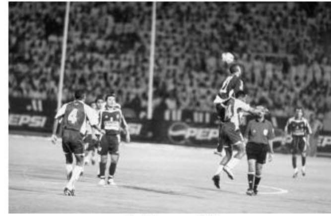
لقطة من ديربي العاصمة