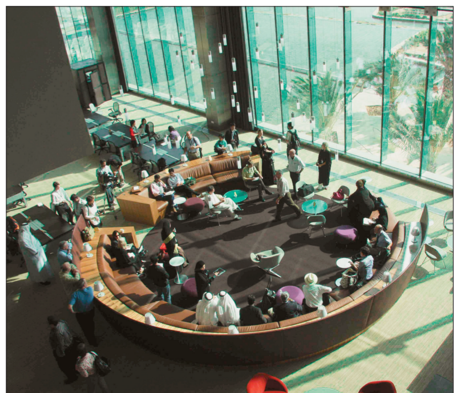
صحافيون أجانب يستمعون إلى شرح عن مكتبة جامعة الملك عبد الله في ثول أمس.