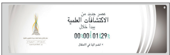
ساعة العد التنازلي كما بدت البارحة قبل ماثول الصحيفة للطبع.

هادي الفقيه - ثول (٠٠٠٠٠٠٠٠٠٠) إنها الثامنة و٤٥ دقيقة من مساء اليوم «عصر جديد من الاكتشافات العلمية يبدأ» جامعة الملك عبد الله للعلوم والتقنية، أصبحت رسميا في الصف الأول بين جامعات ومعاهد العالم البحثية، بقيادة ملك المعرفة عبد الله بن عبد العزيز - صانع الدهشة بفكره ورؤيته التي سيفقد العالم احترامها لها مساء اليوم.