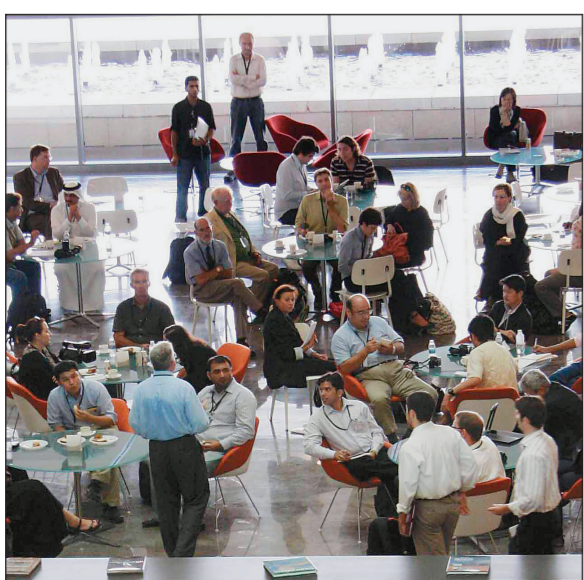
علماء وصحافيون يستريحون لإكمال جولة زيارة الجامعة أمس.