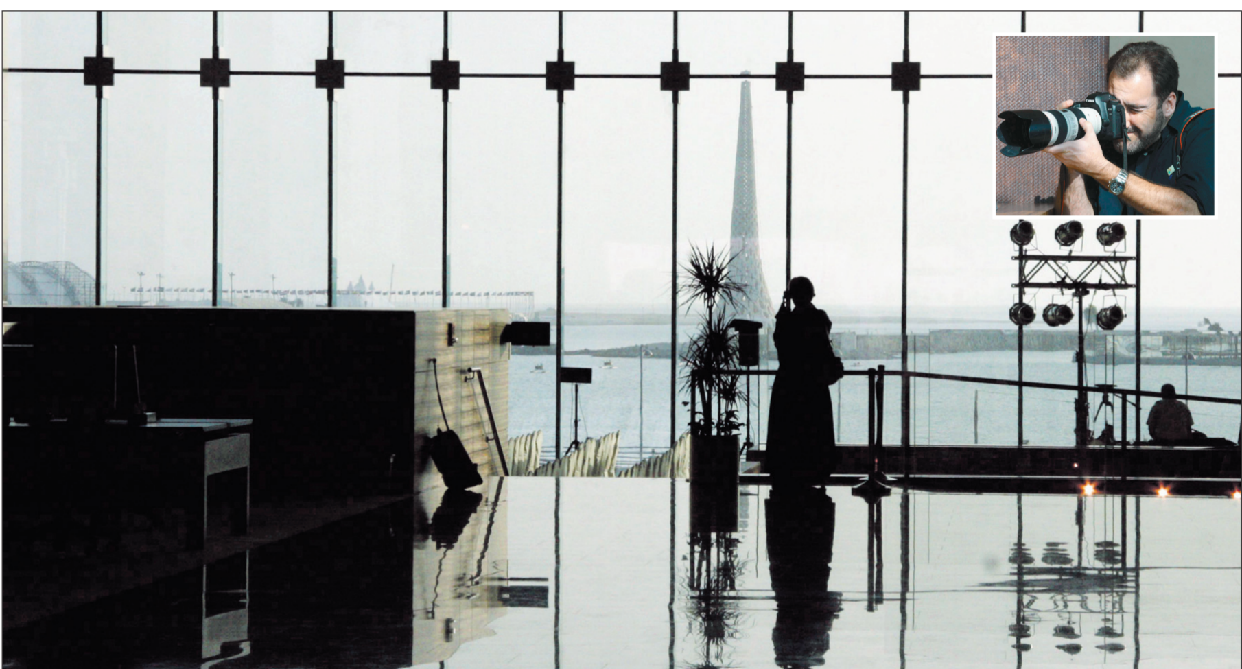
صحافية تلتقط صورة لبرج منارة المعرفة من مكتبة الجامعة، وفي الإطار مصور وكالة أنباء يلتقط صورة في ثول أمس.

- بالطبع لا زال هناك الكثير لينجز بعد جهد التأسيس والافتتاح في فترة زمنية قياسية، وأرى الجزء الآخر هو أن تنجح الجامعة في إنجاز مهمتها خلال السنوات القليلة القادمة وعلى أعلى المستويات والطموح والآمال المعقودة عليها، وهذا برأيي هو النجاح المرتبط بالعمل وتذليل الصعوبات والتحديات التي بلا شك ستواجهنا لننجز مدى دور الجامعة الفعلي وعلى مستوى الجامعات البحثية العالمية أو ربما يفوق بحول الله.