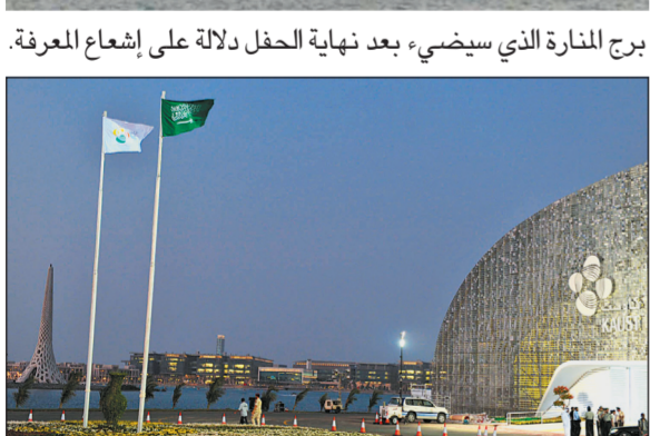
مدخل خيمة الاحتفال كما بدأ أمس على شاطئ ثول.

برج المنارة الذي سيضيء بعد نهاية الحفل دلالة على إشعاع المعرفة.