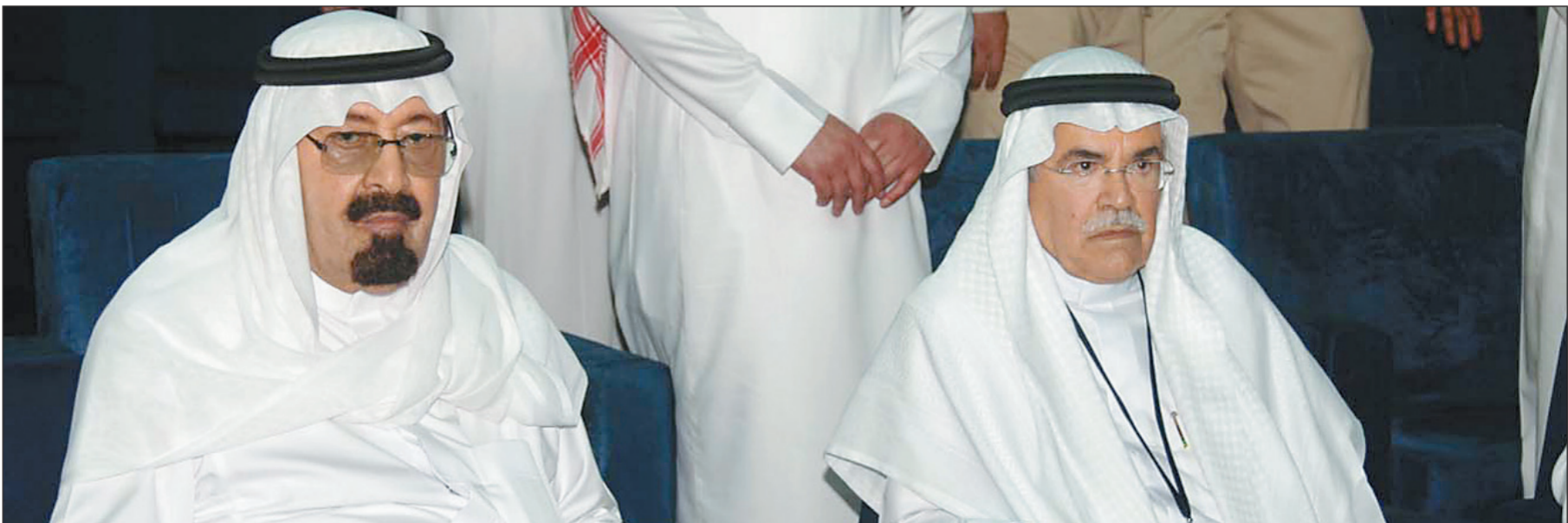
خادم الحرمين الشريفين يجاوره المهندس علي النعيمي في ثول أمس.

أكد رئيس مجلس أمناء جامعة الملك عبد الله للعلوم والتقنية وزير البترول والثروة المعدنية المهندس علي النعيمي في حوار مع «عكاظ» عشية إطلاق الجامعة رسمياً، أن الحفل سيتوج رؤية خادم الحرمين الشريفين.