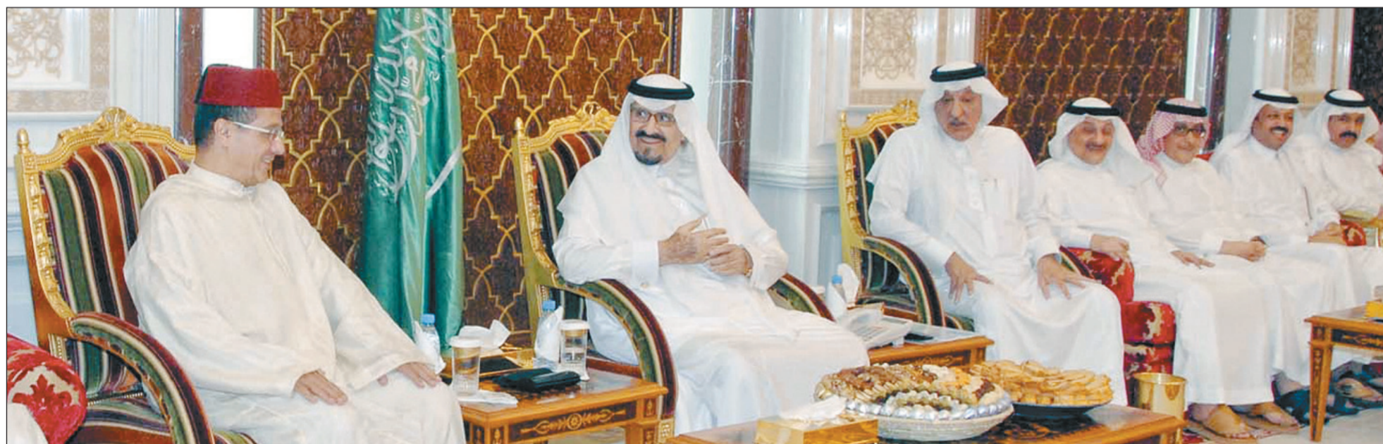
ولي العهد ملتقياً في مقر إقامته البارحة الأولى والي أغادير محمد بوسعيد، ويبدو الأمل خالد بن فهد، خالد بن سعد وفهد بن عبدالله. (واس)

أنه تمت الموافقة على دمج قسم الدراسات العليا الشرعية في قسم الشريعة، ودمج قسم الدراسات العليا التاريخية والحضارية في قسم التاريخ، ودمج شعبة الاقتصاد الإسلامي التابعة لقسم الدراسات العليا