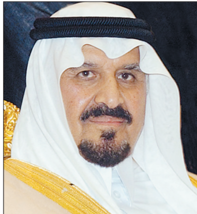
الأمير سلطان بن عبد العزيز

الحلول الناجمة لمعالجتها. وتتضمن أهداف الكرسي، تطوير أداء العمل الميداني في مجال الأمر بالمعروف والنهي عن المنكر في ما يتعلق بمهارات الاتصال وأساليب الإقناع والتأثير المناسب للشباب، إيجاد الحلول العلمية والعملية والبدائل الشرعية، والاستفادة من طاقات الشباب في كل ما يسهم في