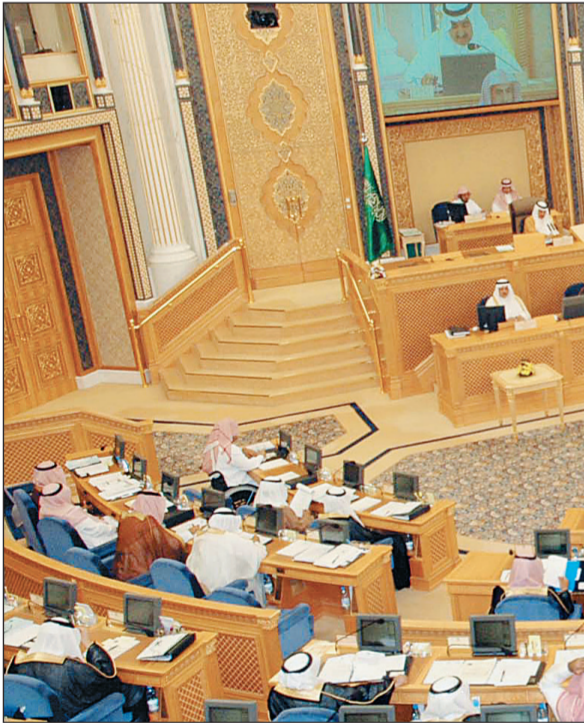
أعمال جلسة مجلس الشورى كما بدت أمس. (واس)

البالغ بتصريحات رئيس سلطة الاحتلال الإسرائيلية بشأن القدس واستمرار سياسة الاستيطان الإسرائيلية فيها. ورأى المجلس في تلك التصريحات تكريساً للسياسات التصعيدية التي ما انفكت تمارسها سلطات الاحتلال الإسرائيلية ضد