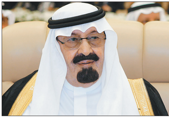
خادم الحرمين الشريفين

وأوضح الحمين أن جدول أعمال الندوة يتضمن كلمة لصاحب السمو الملكي الأمير سلمان بن عبد العزيز أمير منطقة الرياض. وبين الرئيس العام للهيئة أن الندوة ستناقش محاور عدة، وهي: الحسبة في الشريعة الإسلامية، محور أساليب الحسبة وسبلاتها بين الواقع والمأمول، الحسبة في أنظمة المملكة العربية السعودية، ونظام هيئة الأمر بالمعروف والنهي عن المنكر وعلاقته بالإنظمة العدلية والأمنية وغيرها. وتتضمن المناقشات: محور أثر الحسبة وجهود هيئة الأمر بالمعروف والنهي عن المنكر في حماية ثوابت الأمة وتحقيق الأمن، رعاية المملكة العربية السعودية للحسبة منذ التأسيس وحتى الوقت الحاضر، وأثر الحسبة وجهود هيئة الأمر بالمعروف والنهي عن المنكر في مكافحة الجريمة وحفظ حقوق الإنسان.