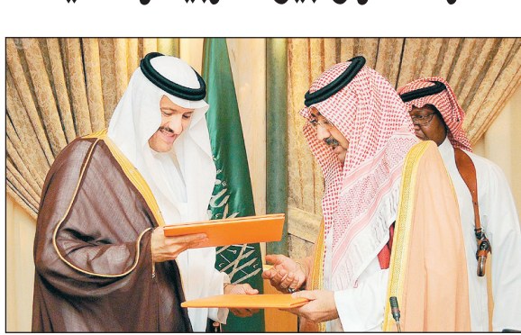
الأمير فيصل بن عبد الله والأمير سلطان بن سلمان عند توقيعهما مذكرة التعاون في الرياض أمس

وقعتها فيصل بن عبد الله وسلطان بن سلمان مذكرة تعاون بين التربية والسياحة