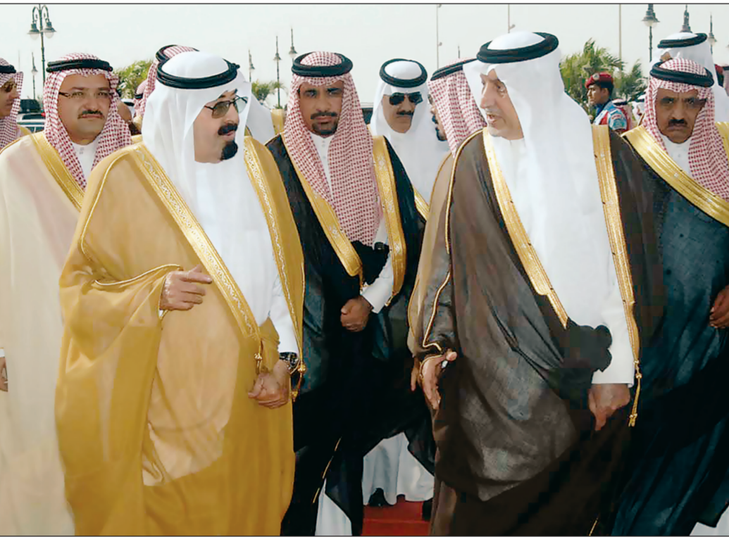
خادم الحرمين الشريفين لدى وصوله جدة أمس قادما من الرياض، وفي مقدمة استقباله الأمير خالد الفيصل، والأمير مشعل بن ماجد. (واس)