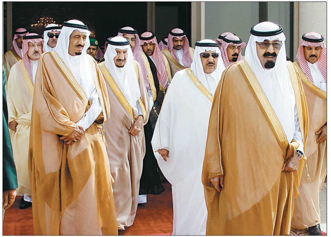
الملك عبد الله بن عبد العزيز مغادراً الرياض أمس، وفي وداعه الأمير متعب بن عبد العزيز، الأمير نايف بن عبد العزيز، الأمير سلمان بن عبد العزيز، والأمير سطام بن عبد العزيز.

وداعه لدى مغادرته مطار قاعدة الرياض الجوية صاحب السمو الأمير محمد بن عبد الله بن جلوي، صاحب السمو الملكي الأمير عبد الرحمن بن عبد العزيز نائب وزير الدفاع والطيران والمفتش العام، صاحب السمو الأمير بندر بن محمد بن عبد الرحمن، صاحب السمو الملكي الأمير نايف بن عبد العزيز، صاحب السمو الملكي الأمير خالد بن سعد بن مساعد بن عبد الرحمن، صاحب السمو الملكي الأمير الدكتور تركي بن محمد بن سعود الكبير وكيل وزارة الخارجية للعلاقات متعددة الأطراف، صاحب السمو الملكي الأمير الدكتور منصور بن متعب بن عبد العزيز وزير الشؤون البلدية والقروية، كما كان في وداعه، أمراء، ووزراء، ورئيس مجلس الشورى الدكتور عبد الله آل الشيخ.