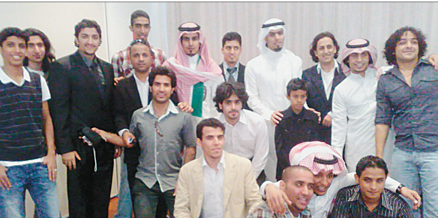
مبتعثون سعوديون في أستراليا في لحظة تعبر عن فرحهم بصدر الأمر الملكي أمس.