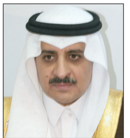
الأمير فهد بن سلطان محمد الساعد، محمد سداد، تبوك.

أكد صاحب السمو الملكي الأمير فهد بن سلطان بن عبد العزيز أمير منطقة تبوك أن الخدمات في المنطقة بلغت ١٠٠ في المائة، في ما يتعلق بمشاريع الصرف الصحي، شبكات المياه، الكهرباء، الطرق، الصحة، والتعليم. وقال الأمير فهد في تصريح صحافي خلال احتفام زيارته التفقدية لمحافظة ومراكز المنطقة، إن البعض يشك في هذه النسبة، إلا أن الواقع الحالي الذي تعيشه المنطقة، شاهد على تأمين الاحتياجات من البنية التحتية لدى كافة محافظات المنطقة.