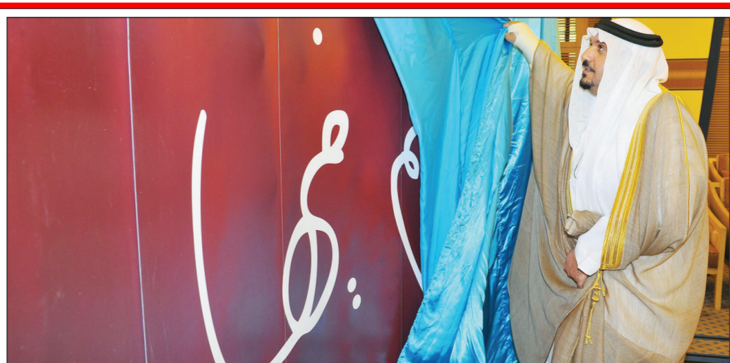
الأمير د. فيصل بن مشعل بن سعود يزيح الستار أمس، إباناً بانطلاق حملة (كبدك يا الغالي غالية).

«عكاظ». القصيم دشن صاحب السمو الملكي الأمير الدكتور فيصل بن مشعل بن سعود بن عبد العزيز نائب أمير منطقة القصيم رئيس مجلس إدارة الجمعية السعودية الخيرية لمرضى الكبد (كبدك) أمس، اليوم العالمي للكبد الذي يبدأ لأول مرة في المملكة تحت شعار «كبدك يا الغالي غالية» (اهتم فيها) بالتعاون مع الجمعية السعودية