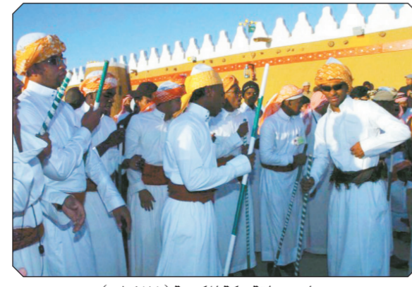
جناح منطقة مكة المكرمة (١٤٢٨هـ).

بلادي بلاد الخير ورجالها الأخبار ونبع الهدى مكة ونور الهدى طيبة ومن له وطن قبل نرى موطنه لو جار وأنا شامخ في موطن العز والهيبة هذا وطننا والوطن غالي واللي يخونه ما يخاف الله ولحن الوطن يطرب له البحر والبحار وأنا أفق على الساحل واغني ولا لي به ولا غير لحنك يا وطن يطرب السمار ولا اسمع لشعر ما سجع بك ولا لي به هذا وطننا والوطن غالي