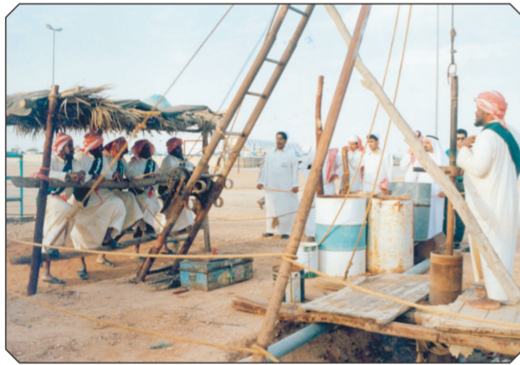
استخراج الماء من الآبار للزراعة والحرث كما كان في حياة الأجداد.