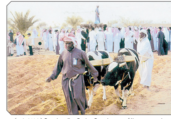
مزارع يحرق الأرض بطريقة بدائية .. الجندرية (١٤٢٤هـ).