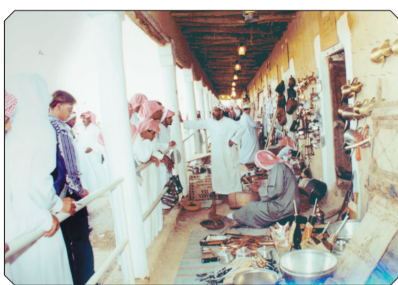
زائرون يشاهدون بعضاً من الصناعات الشعبية في الجندرية (١٤٠٨هـ).