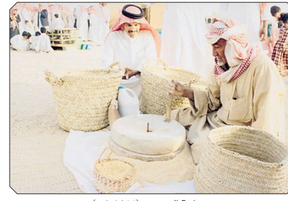
صناعة الخوص (١٤١٧هـ).