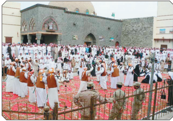
الخيمة الثقافية في بيت المدينة (١٤٢٧هـ).