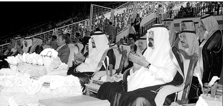
خادم الحرمين لدى تشريفه حفل أهالي منطقة جازان في زيارته الأخيرة للمنطقة.