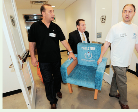
فلسطينيون يحملون مقعد فلسطين المنتظر في الأمم المتحدة في نيويورك أمس.