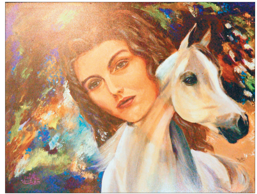
إحدى اللوحات المشاركة في المعرض.