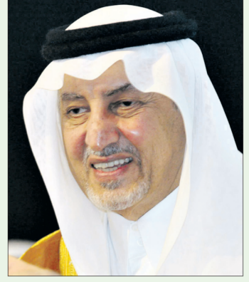
الأمير خالد الفيصل

يخاطب صاحب السمو الملكي الأمير خالد الفيصل أمير منطقة مكة المكرمة الليلة مثقفي المملكة خلال افتتاحه مبنى نادي جدة الأدبي «قاعة حسن شريفتي» التي تبرعت بها مؤسسة أبناء محمد حسن شريفتي. ويشهد حفل الافتتاح وزير الثقافة والإعلام الدكتور عبدالعزيز خوجة وأعضاء اللجنة الثقافية في مجلس الشورى ورؤساء الأندية الأدبية وأكثر من ١٠٠ مثقف من أنحاء المملكة، تشمل فقرات الحفل على عرض مسرحي لقصيدة «جدة» للشاعر حمزة شحاتة وعرض فلكلوري وحاسوبي لمرحلة تشييد القاعة وكلمات خطابية.