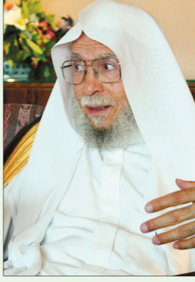
د. عبدالله التركي

تستعد رابطة العالم الإسلامي لمؤتمر مكة المكرمة الـ ١٢ الذي تقيمه سنويا قبيل موسم الحج برعاية كريمة من خادم الحرمين الشريفين. ويتطرق المؤتمر الذي يقام من ٣ إلى ٦ ذي الحجة تحت عنوان «الدعوة الإسلامية.. الحاضر والمستقبل». من جانبه، أوضح الأمين العام للرابطة الدكتور عبدالله بن عبدالحسن التركي أن المؤتمر ينصّل بمؤتمر مكة الأول الذي دعا إليه الملك عبدالعزيز علماء الأمة للاجتماع في مكة عام ١٣٤٥هـ، لدراسة واقع المسلمين والمشكلات التي تواجههم. ووجه التركي شكره وتقديره لخادم الحرمين الشريفين، ولولي عهده الأمين، والنائب الثاني على مساندتهم للرابطة ودعم برامجها.