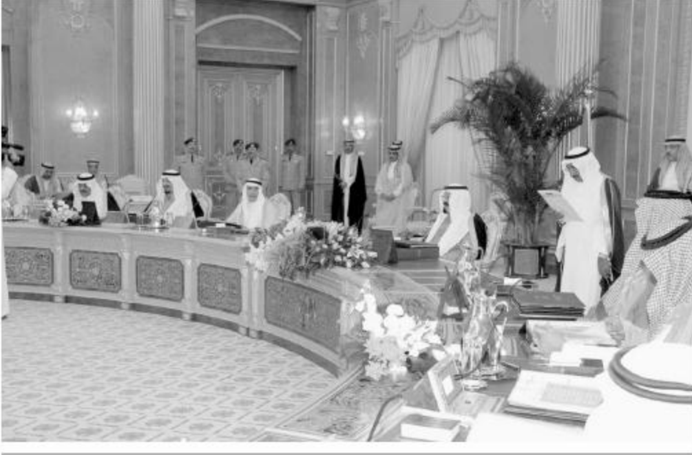
تعيين الفايز وأبو ذراع والسعدي على المرتبة ٤٤

راس صاحب السمو الملكي الأمير عبد الله بن عبد العزيز آل سعود ولي العهد نائب رئيس مجلس الوزراء رئيس الحرس الوطني - حفظه الله - الجلسة التي عقدها مجلس الوزراء بعد ظهر أمس الاثنين في قصر اليمامة بمدينة الرياض. وبين معالي وزير الثقافة والإعلام الأستاذ إياد بن أمين مدني في بيانه لوكالة الأنباء السعودية عقب الجلسة ان مجلس الوزراء قد اطع على نتائج القمة العربية السابعة عشرة التي عقدت بالجزائر، واعرب المجلس عن ارتياحه لما تحضنت عنه من قرارات لدعم العمل العربي المشترك، وعلى وجه الخصوص ما جاء فيها من تجديد القيادة الالتزام بمبادرة السلام العربية باعتبارها المشروع العربي لتحقيق السلام العادل والشامل والدائم في المنطقة، ومساندة القيادة حق لبنان السيادة في ممارسة خياراته السياسية، وتأكيد القيادة على أهمية إصلاح منظومة الأمم المتحدة وتضمين تلك الإصلاحات استعادة وتعزيز دور الجمعية العامة في حفظ السلام والأمن الدوليين والحد من استخدام حق النقض إلى أقصى الحدود، وتشديد القيادة على ضرورة تنفيذ الدول بسداد الحصص السنوية الكاملة في مواقيتها المحددة وبعملة الموازنة، وسداد المتأخرات وفق الجدولة التي تمت في قمة تونس.