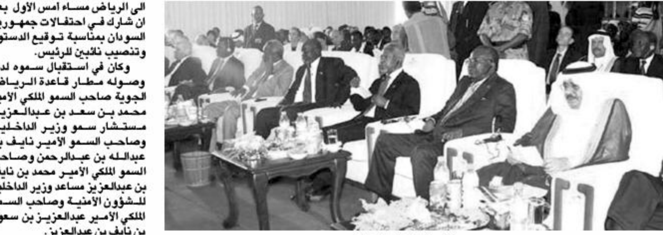
سموه خلال مشاركته في الاحتفالات