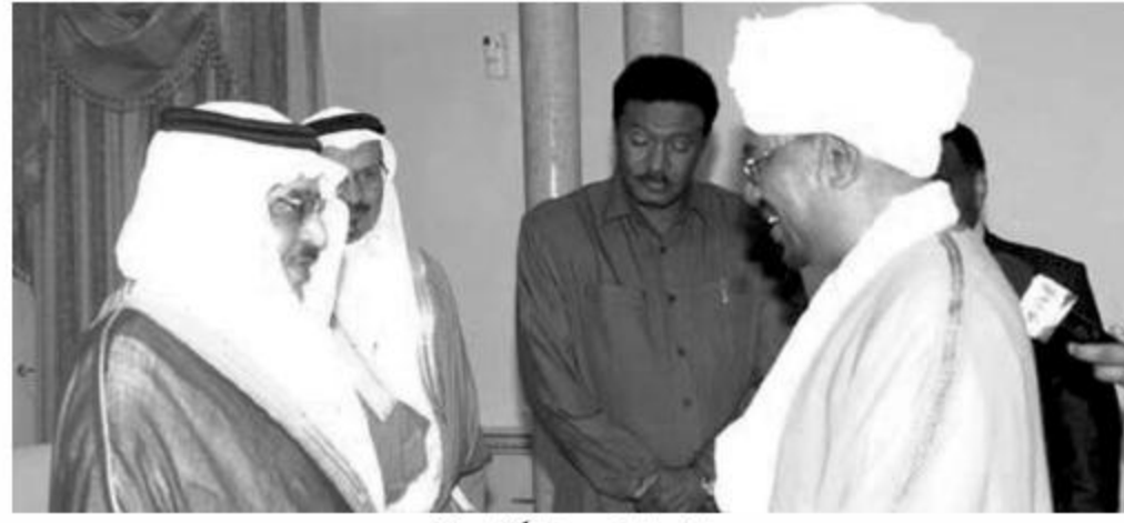
الرئيس البشير مستقبلاً الأمير نايف

جون قرنق نائباً أول لرئيس الجمهورية وتعيين علي عثمان محمد طه نائباً لرئيس الجمهورية ثم أدى الدكتور جون قرنق وعلي عثمان طه القسم.