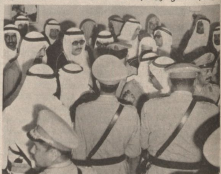
جلالة الملك يصافح المواطنين الذين كانوا في استقباله في المطار