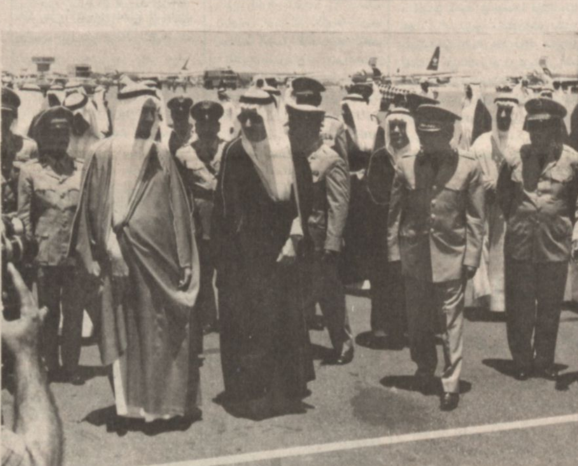
جلالة الملك بعد نزوله من الطائرة ..

الفصيل وصاحب السمو الملكي الامير فواز بن عبد العزيز امير منطقة مكة المكرمة وصاحب السمو الملكي الامير احمد بن عبد العزيز وكيل امارة منطقة مكة المكرمة .. يقف جلالتهم على منصة الشرق ومنه سمو الامير فواز بن عبد العزيز امير منطقة مكة المكرمة وتعزف الموسيقى السلام الملكي .. ويخل جلالته صالة الاستقبال بالمطار .. ومعه اصحاب السمو الملكي الامراء .. ويتدافع الناس الى الملك واخوته