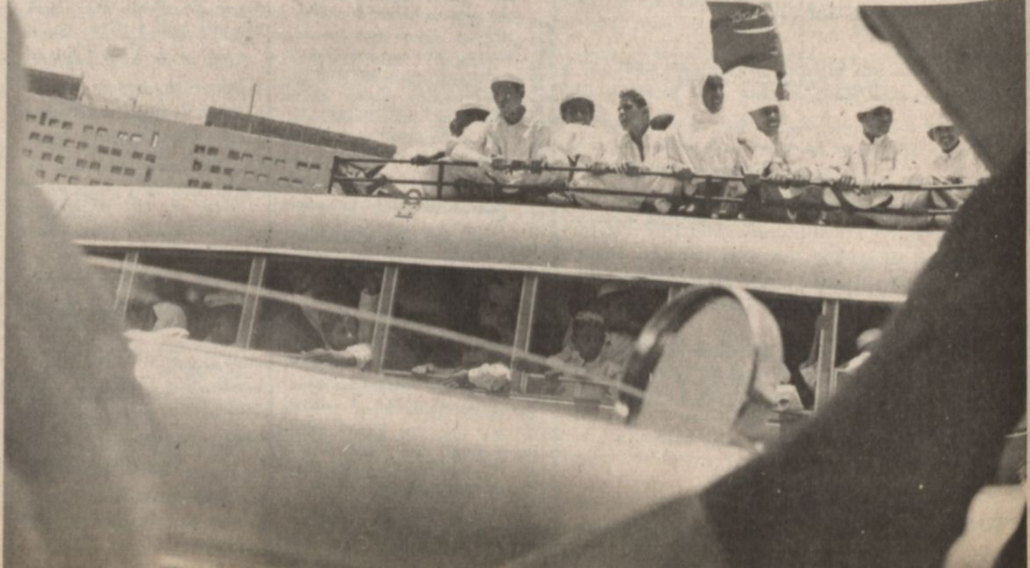
جموع غفيرة من ابناء الشعب خرجت لاستقبال قائدها