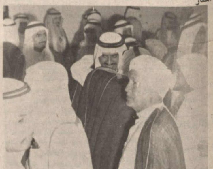
سمو الامير سلطان كان في معية جلالته الملك امس