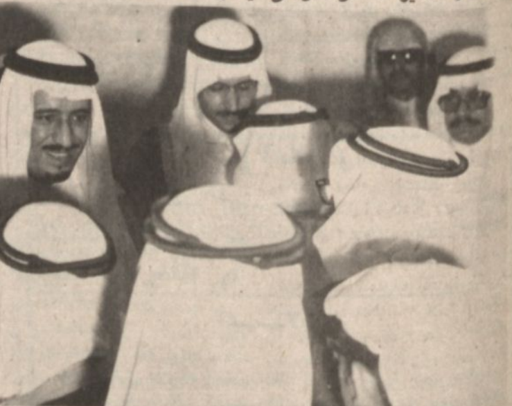
وسمو الامير سلمان